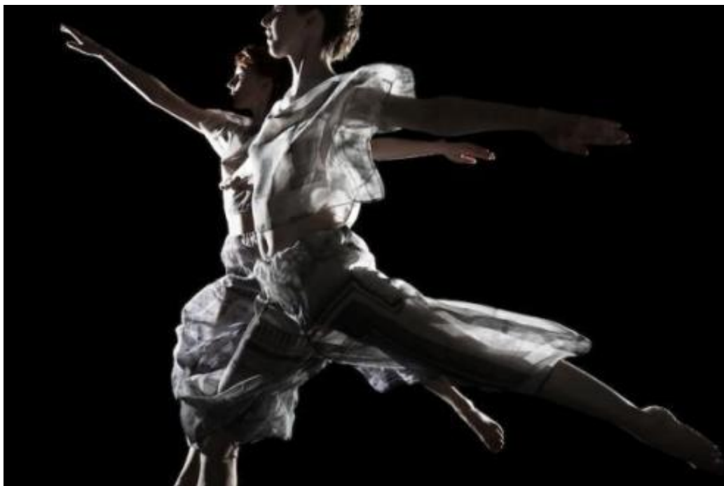
SET AND RESET / FOTO: JULIETA CERVANTES

V Španske borce 5. decembra ob 20. uri prihaja plesna skupina ikone postmoderne plesa, Trishe Brown, gostovanje pa je zgodovinski trenutek, saj skupina po turneji zaključuje z delom, gostovanje v Španskih borcih pa je zadnji evropski nastop v okviru poslovilne turneje Proscenium Works 1979-2011 z odrskimi koreografijami te velike ameriške plesne ustvarjalke v izvirnem kontekstu.