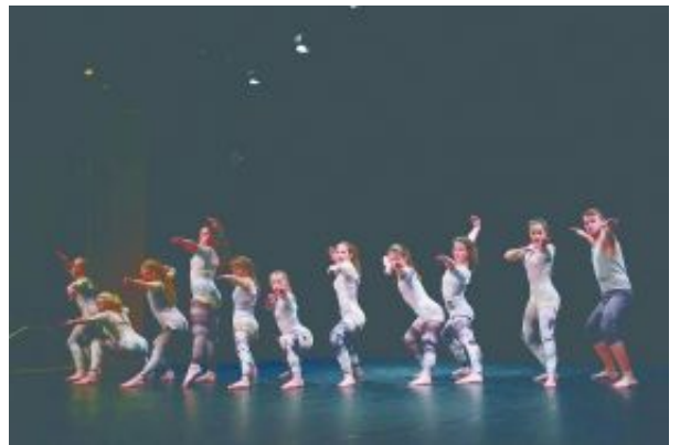
Festival plesne ustvarjalnosti mladih Živa predstavlja presek aktualne plesne ustvarjalnosti izbranih plesnih skupin in posameznikov iz Slovenije in tujine. Z