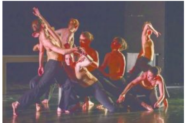
Galerija Plesa Maribor sodeluje s predstavo Brez izhoda.