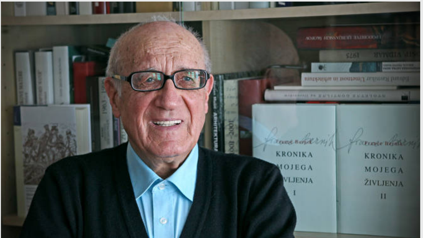
Akademik France Bernik.

Ključne besede: Društvo Rastoča knjiga , France Bernik , Državni svet