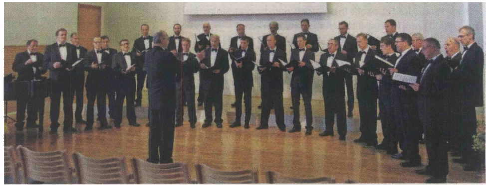
Komorni moški pevski zbor Davorina Jenka iz Cerklj se je na regijskem tekmovanju izkazal z zlatim priznanjem.

Škofja Loka – Preteklo soboto je v organizaciji škofjeloške območne izpostave JSKD v Kristalni dvorani Sokolskega doma v Škofji Loki potekalo regijsko tekmovanje odraslih pevskih zasedb. V treh koncertnih sklopih je nastopilo petnajst odličnih gorenjskih pevskih zasedb – najprej dva moška zbora in male pevske skupine, sledili so ženski in nazadnje še mešani zbori. Sicer je nekaj pevskih zborov tokrat manjkalo, kar pa vsekakor ne zmanjšuje kakovosti najboljših med prisotnimi. Vsaka skupina se je predstavila s štirimi pesmimi, od katerih je morala biti ena umetna pesem slovenskega skladatelja, napisana po letu 1985, ena slovenska ljudska, dve skladbi pa sta bili prepuščeni lastni izbiri. Sestavi so skladbe izbrali večinoma v skladu s svojimi pevskimi kvalitetaми, zato lahko rečemo, da so bili njihovi nastopi, gledano v celoti, zelo uspešni. Pa vendarle je strokovna komisija, ki so jo tokrat sestavljali eminentni glasbeniki: dirigent