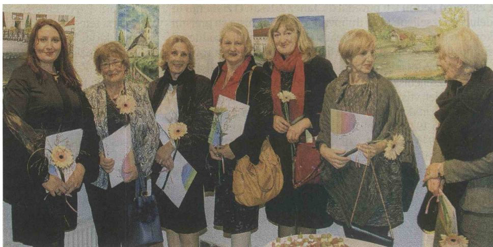
Z odprtja razstave del likovne kolonije Nazarje skozi čas, ki je na ogled od petka. Na fotografiji so nekatere udeleženke kolonije.