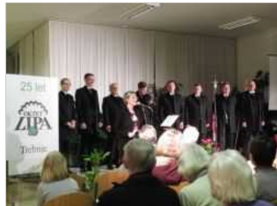
Trebanjski oktet Lipa je sinoči pripravili slavnostni koncert ob 25-letnici svojega delovanja.