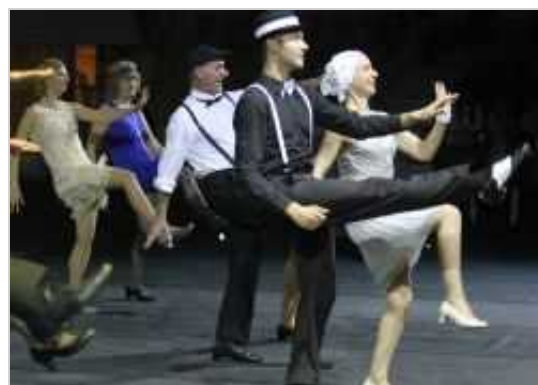
V Novo mesto pridejo sodobni plesi.