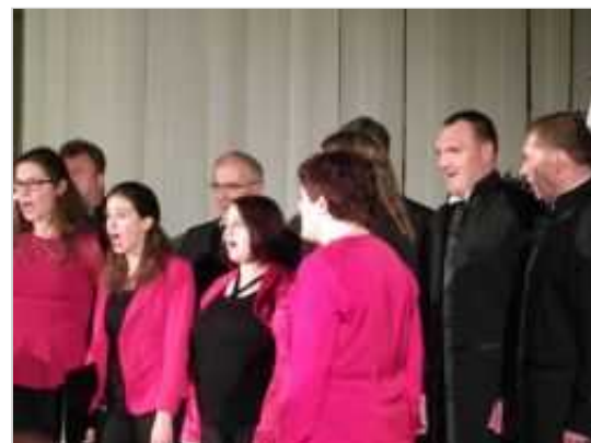
Gostje koncerta so bile članice Ženskega pevskega zbora KTD Dobrnič.