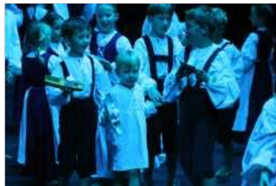
Noč na Krki