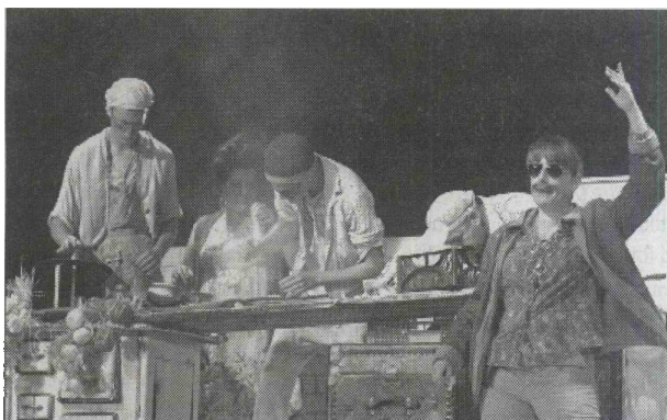
Iz komedije Aulularia v postavitvi dramske družine F.B. Sedej

V števerjanski dramski družini se veselijo ponovnega pomembnega priznanja, ki vsem igralcem in zaodrskim delavcem pomeni dragoceno nagrado za kakovostno opravljeno delo. Po decembrskem premoru bodo števerjanski igralci nastopili 17. januarja na velikem odru SNG Nova Gorica, 24. januarja pa jih čaka gostovanje v Slovenj Gradcu.