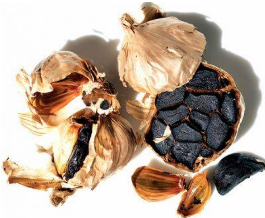
Glavica mamljivega črnega česna za glasovalce in ...

V tokratnem glasovanju vas bomo nagradili s prav posebnimi dobrotami in ekskluzivnimi izdelki iz Hiše Črnega Česna. Črni česen je ekstravaganten in očarljiv posebnost, milega sladkega okusa ter želatinaste strukture. Nasičen je z antioksidanti, aminokislinami in drugimi sestavinami, nujno potrebnimi za naše zdravje in splošno počutje. V svetu je poznan kot česnov močnejši brat, in kar je tudi pomembno, je povsem "Kiss Friendly", saj ne pušča nobenega zadaha. Nekaj stročkov črnega česna na dan ponuja ne samo slastne, temveč predvsem tudi zdrave grizljajčke. Pet glasovalcev bo prejelo glavico črnega česna in bo lahko uživalo v njegovih prijetnih okusih ter aromah ali pa preizkusilo kakšnega od receptov na www.blackgarlichouse.si