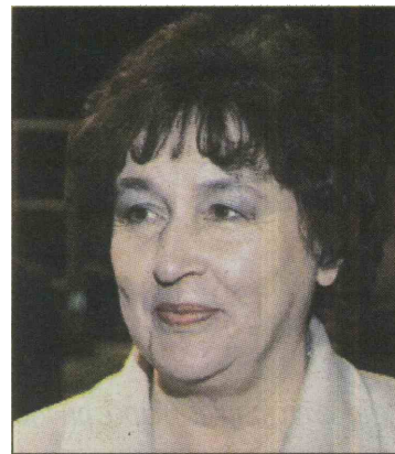
Julijana Bizjak Mlakar