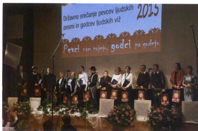
Vodje skupin ob prejemu zlatih priznanj.