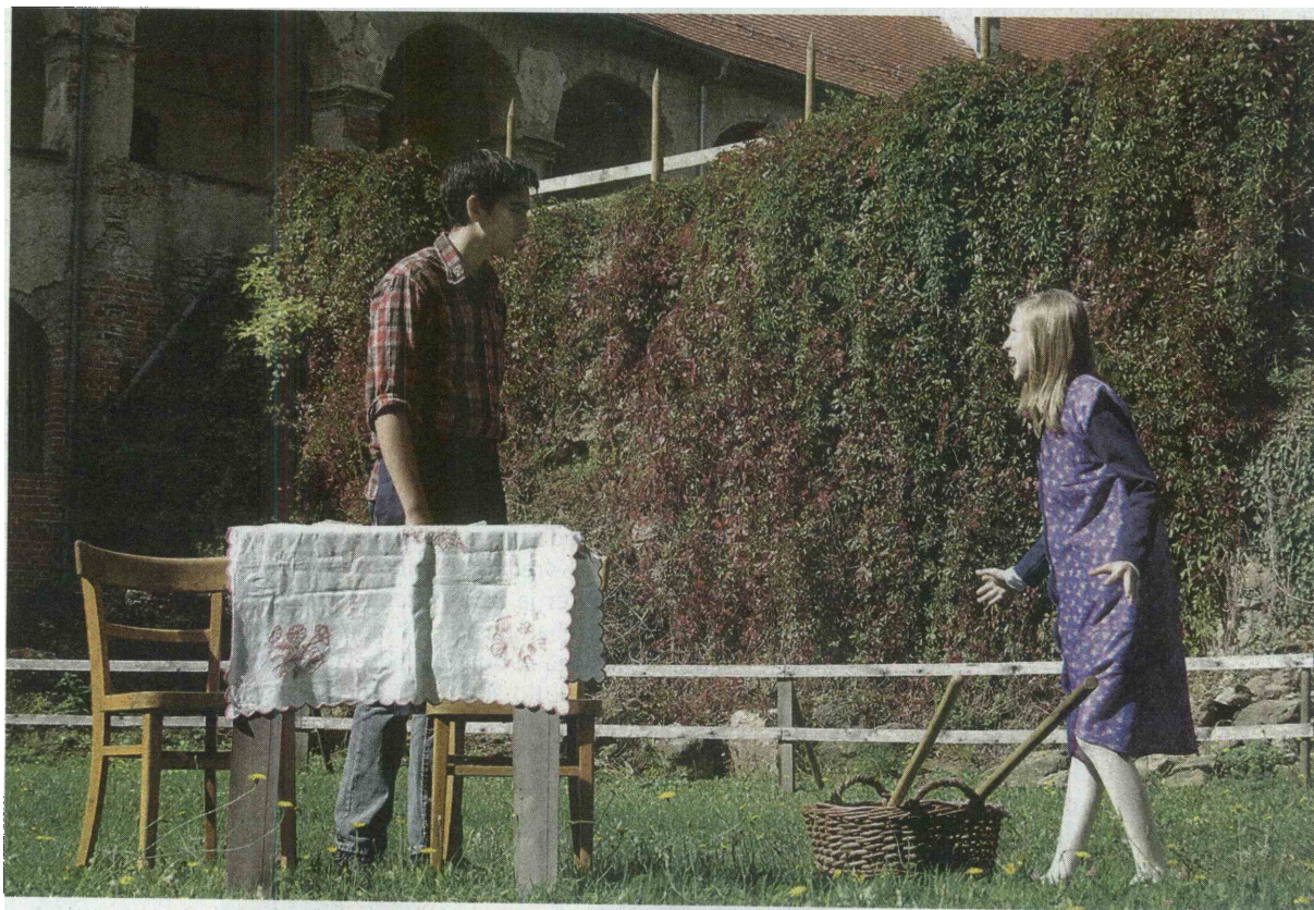
Učenci Osnovne šole Grad so na grajskem dvorišču največjega slovenskega gradu predstavili prizore iz bogate zakladnice življenjskih, koledarskih in delovnih šeg.