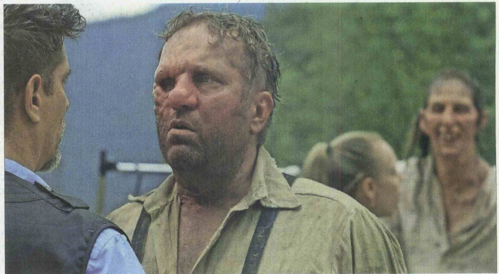
Idila v kratkem prihaja na velika platna domačih kinematografov.