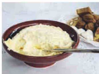
Obiskovalci so lahko poskusili številne dobrote, med njimi tudi korenčkov namaz.