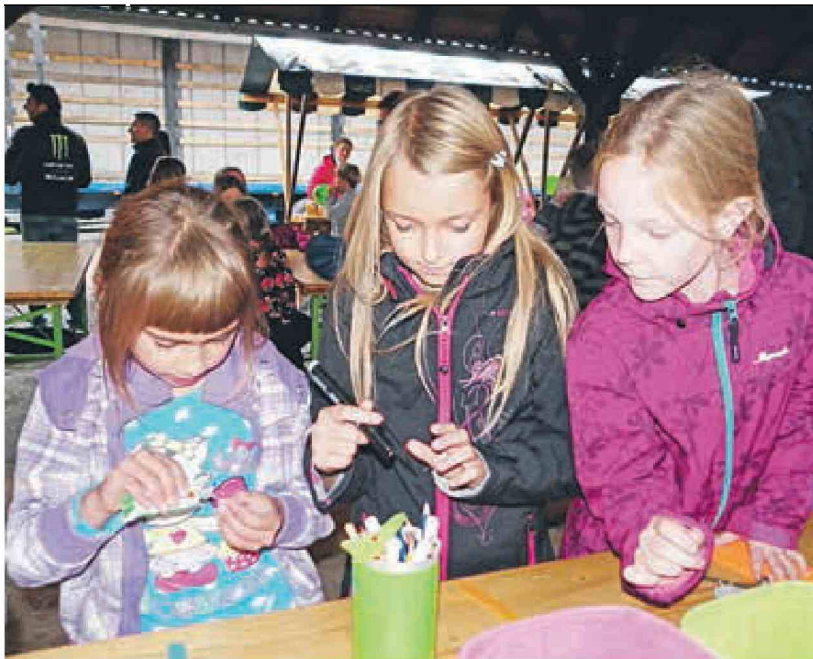
Najmlajši pa so uživali na ustvarjalnih delavnicah.