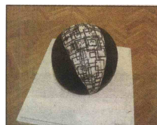
Razstavo zaznamujejo kvadratne in okrogle oblike.

tost v samo izraznost. Materialnost oblik se strukturira skozi materijo – barve, lesa, železa, keramike in tekstila –, ki na svojstven način ustvarja vsebino, podobo, iluzijo, globino in prostor. Univerzalnost oblik – krog, kvadrat – dopušča širok spekter poetičnih možnosti preoblikovanja. Dela s svojo pripovednostjo popeljejo skozi miselno mreženje različnih možnosti interpretiranja in govorijo o individualnosti interpretacij.