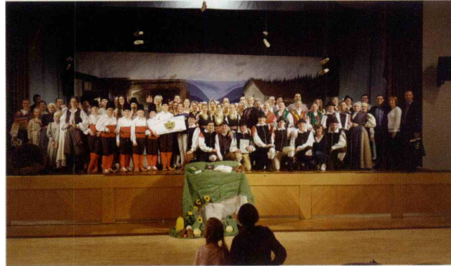
Na koncertu so se člani FS Jurij Vodovnik Skomarje zahvalili vsem, ki jim pomagajo in stojijo ob strani.