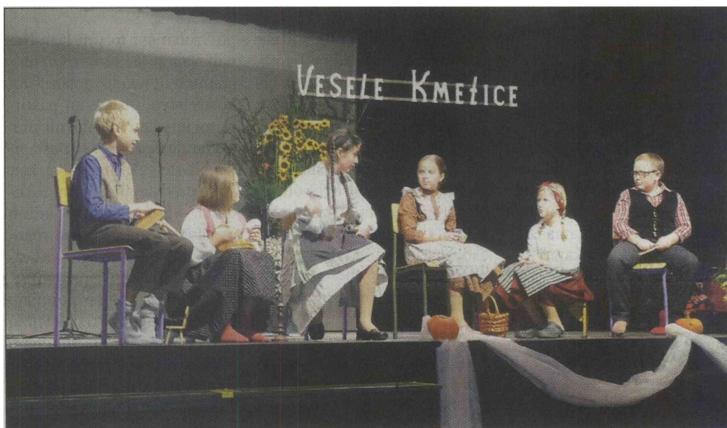
Prireditev so popestrili otroci OŠ Mežica s kratko igro o knapovskem, rudarskem življenju.