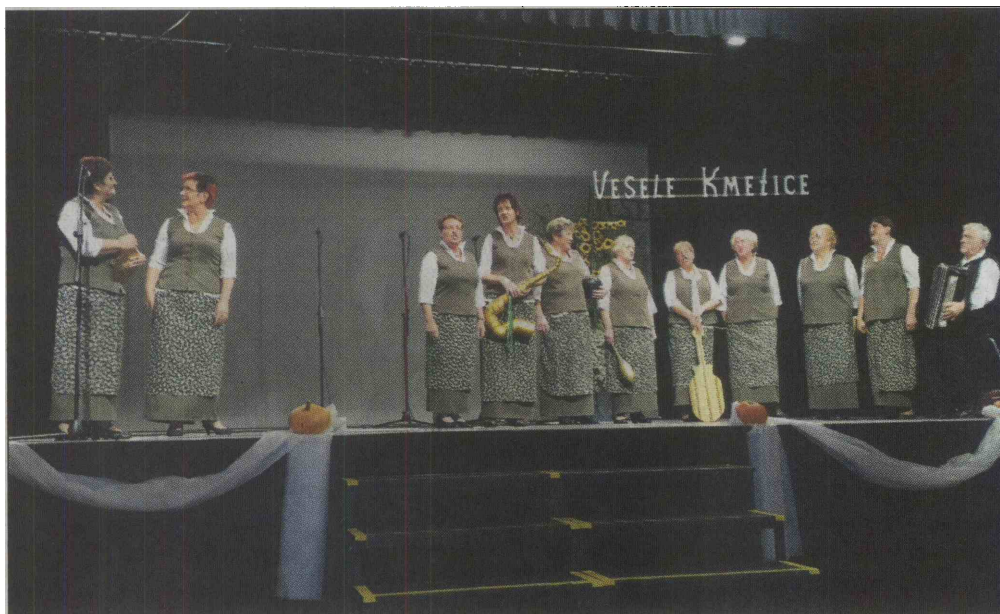
Bršljanke iz Društva kmetic Mislinjske doline