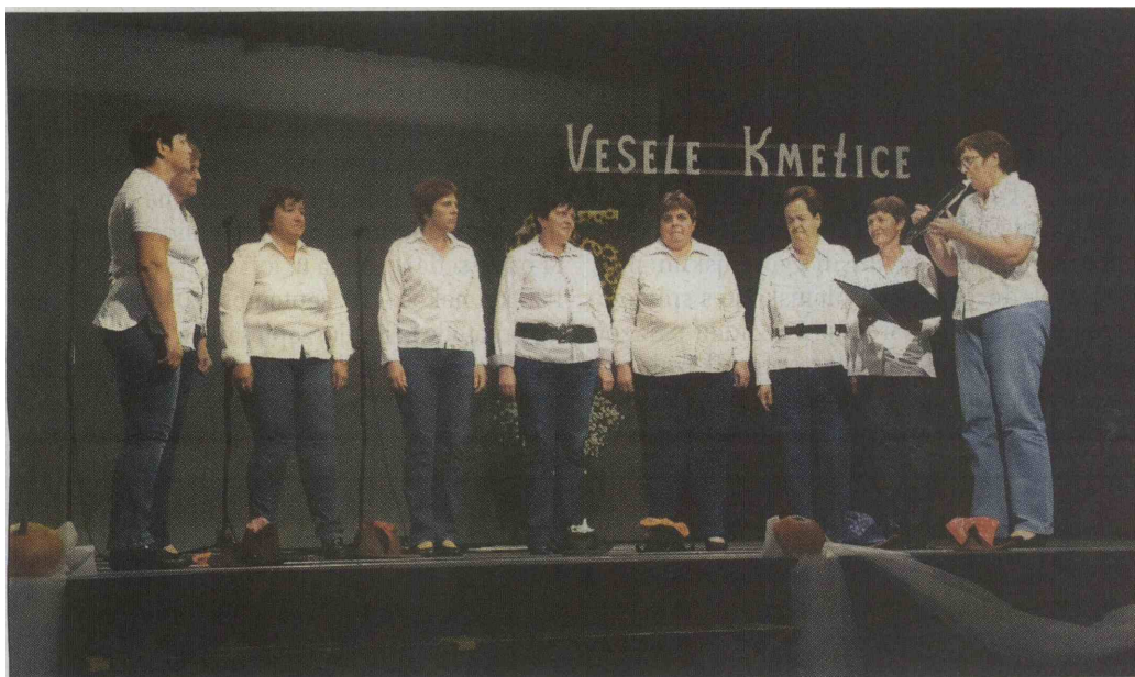
Iz Poljanske doline so prišle pevke skupine Blegoške sinice.