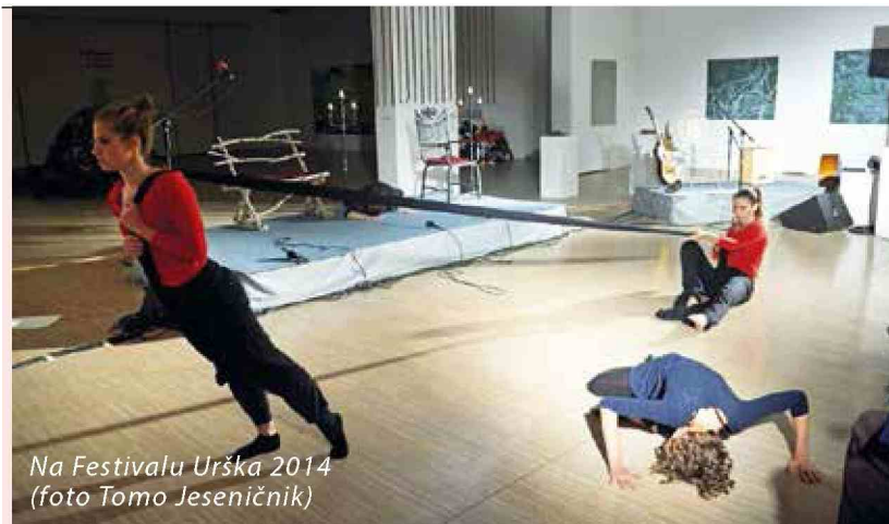
Na Festivalu Urška 2014

ca, osrednja prireditev bo v kulturnem domu ob 20. uri. Takrat bodo predstavili nagrajence in razglasili Uršljana 2015. (AP)