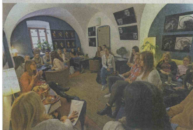
Literarno druženje s finalisti in dijaki slovenjgraške gimnazije