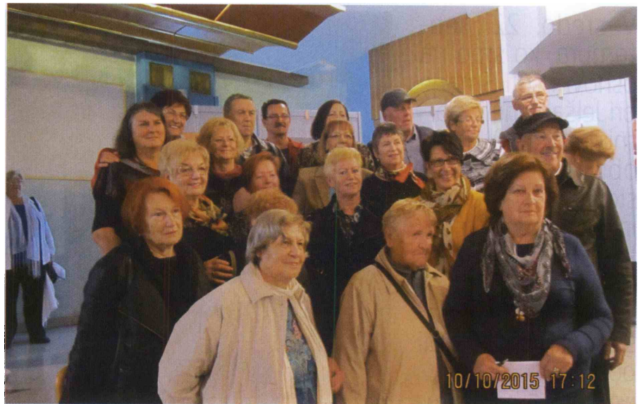
Udeleženci likovne kolonije.

Tri leta traja kulturni projekt v Rogaški Slatini, ki ga organizira Komisija za kulturo Zveza društev upokojencev Slovenije (ZDUS) v sodelovanju s hotelom Delfin Izola ob podpori javnega sklada za kulturne dejavnosti .