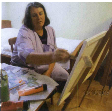
Likovnica v svojem stilu.