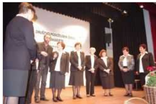
Ljudske pevke Čebelice iz Mirne Peči že vrsto let prijateljujejo s Šmarjetkami.