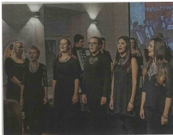
Dneve srbske kulture v Kranju je v gradu Khislstein odprl nastop skupine Brđanke.

račun prišli v soboto ob veličastni sklepni prireditvi Razigrana mladost, ki je potekala v Domu krajanov na Primskovem. Pestri in atraktivni folklorni nastopi osmih skupin iz Srbije, Italije in Slovenije niso nikogar pustili ravnodušnega. »Kulturno društvo Brdo uspešno predstavlja srbsko kulturo in ljudsko izročilo skozi folkloro, ljudske