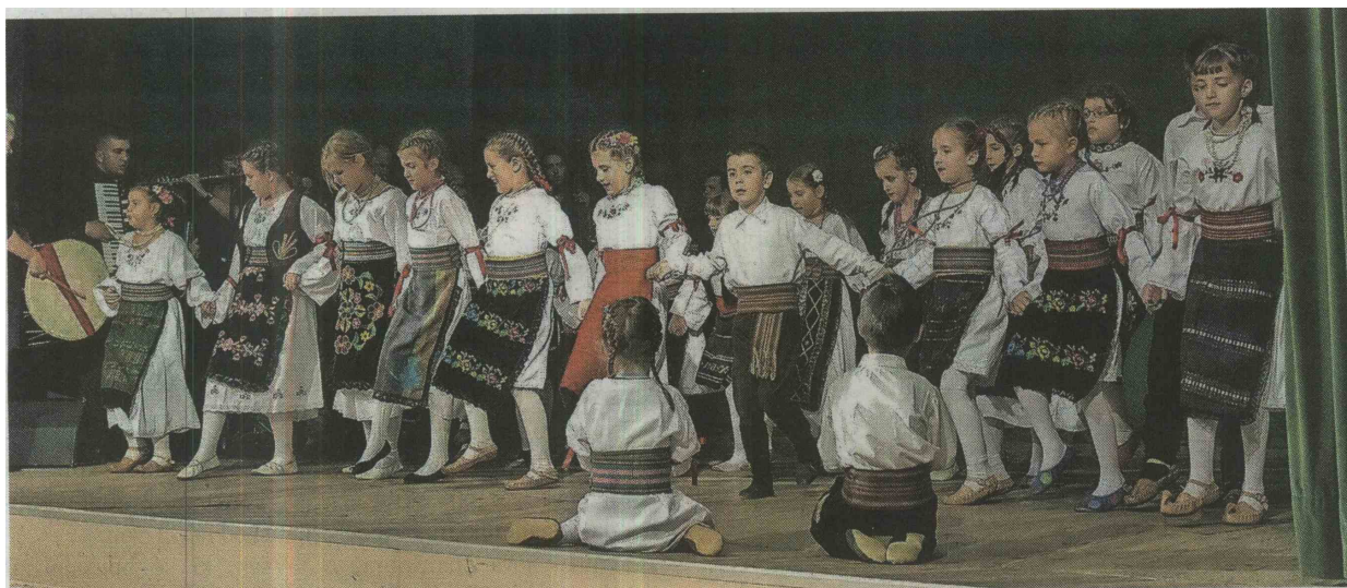
Na prireditvi Razigrana mladost so navdušili tudi najmlajši.