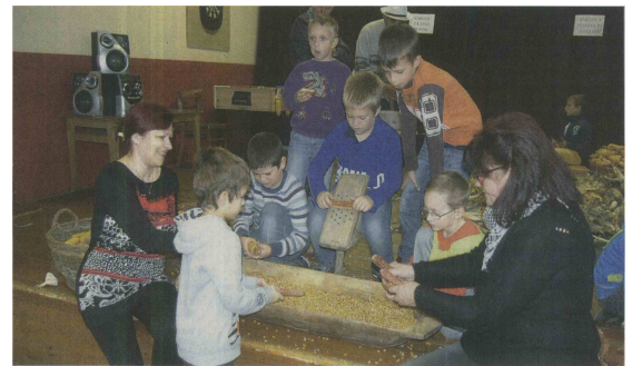
Nekateri otroci so se prvič lotili kmečkih opravil svojih prednikov.