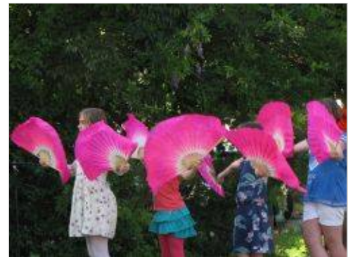
Ples s pahljačami

Po podelitvi priznanj so organizatorji pripravili pravo kitajsko pojedino, ki je druženje v Parku Rastoče knjige še popestrilo.