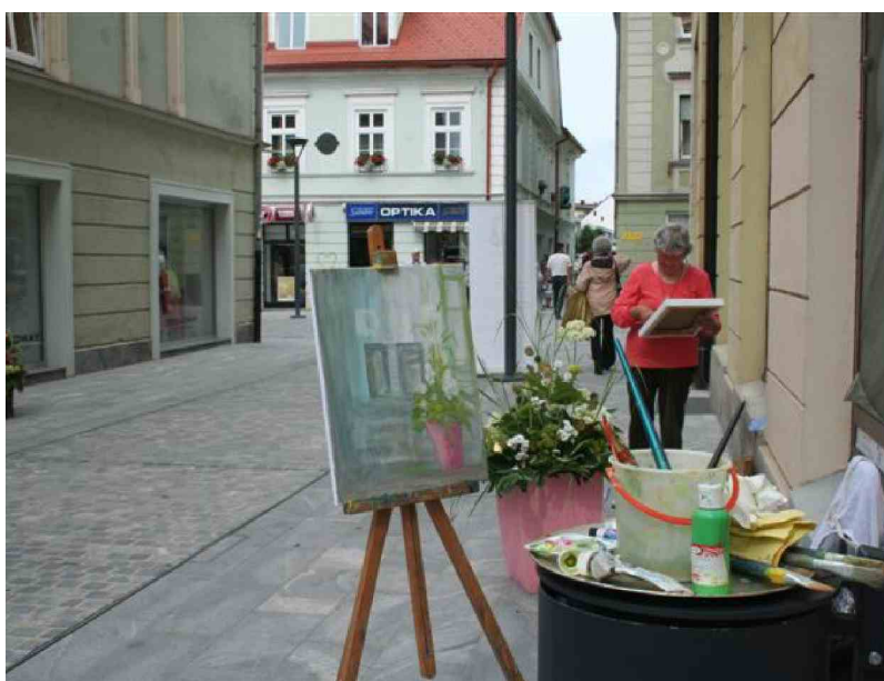
Poletno poulično slikanje so namenili tihožitju.