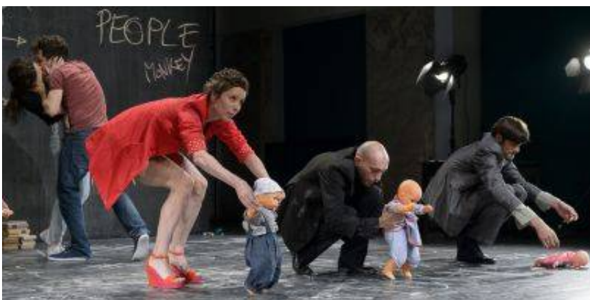
Predstava Manipulacije

Premierno postavitve na festivalu in v Centru urbane kulture Kino Šiška bo uzrl tudi najnovejši scenski performans Manipulacije v produkciji Via Negativa, režiserja Bojana Jablanovca , kjer se raziskuje splošna tematika zaupanja, izhodišče pa vsesplošno manipuliranje, saj vsi manipuliramo z zaupanjem, tako da v končni fazi ni ne krivcev in ne žrtev.