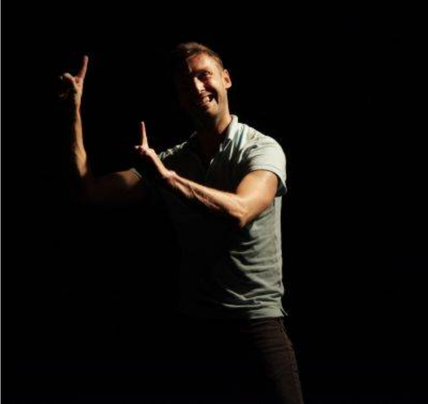
Predstave Praznina