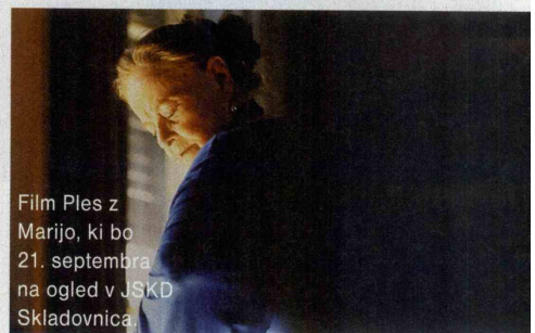
Film Ples z Marijo, ki bo 21. septembra na ogled v JSKD Skladovnica