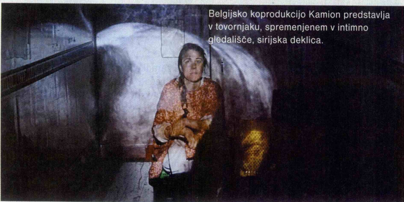
Belgijsko koprodukcijo Kamion predstavlja v tovarnjaku, spremenjenem v intimno gledališče, sirijska deklica.