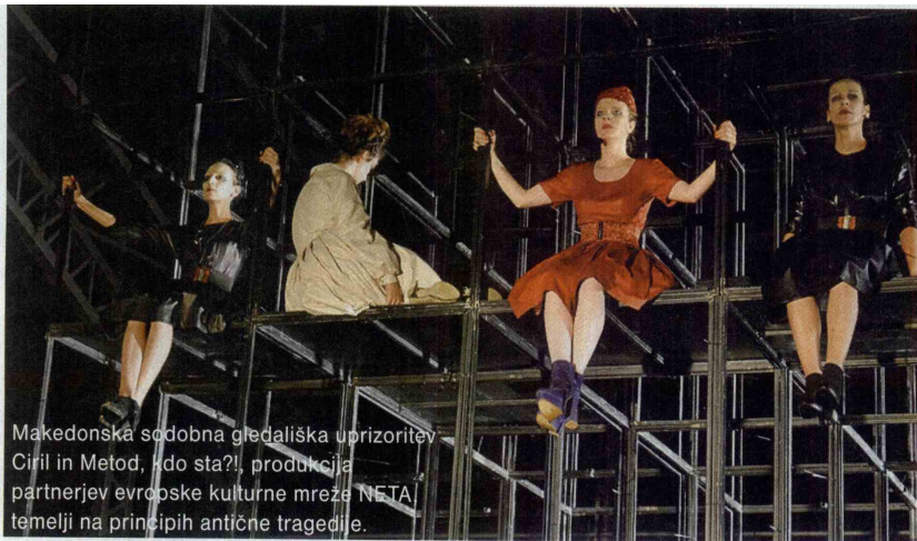
Makedonska sodobna gledališka uprizoritev Ciril in Metod, kdo sta?!, produkcija partnerjev evropske kulturne mreže NETA temelji na principih antične tragedije.