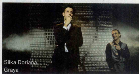
Slika Doriana Graya