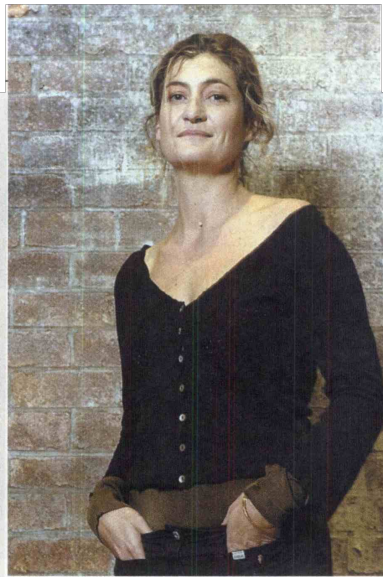
Vandin testament si lahko ogledate 20. septembra v Mini teatru.