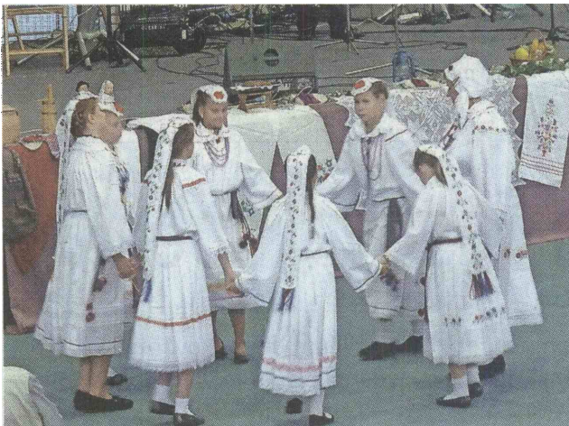
Najmlajše folkloristke škofjeloškega društva Komušina