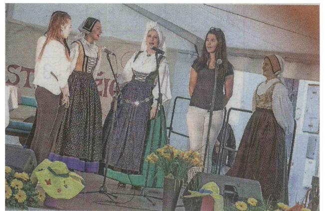
Folklorna skupina Karavanke je za iskriv nastop požela zaslužen aplavz.