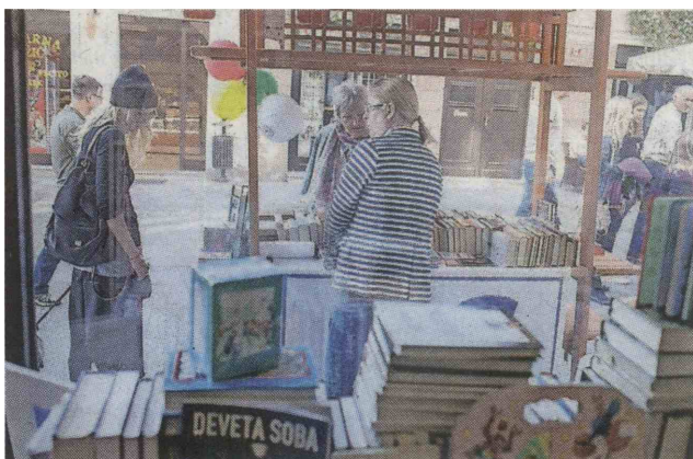
Založniki so tržiške ulice preplavili s knjižnimi stojnicami.