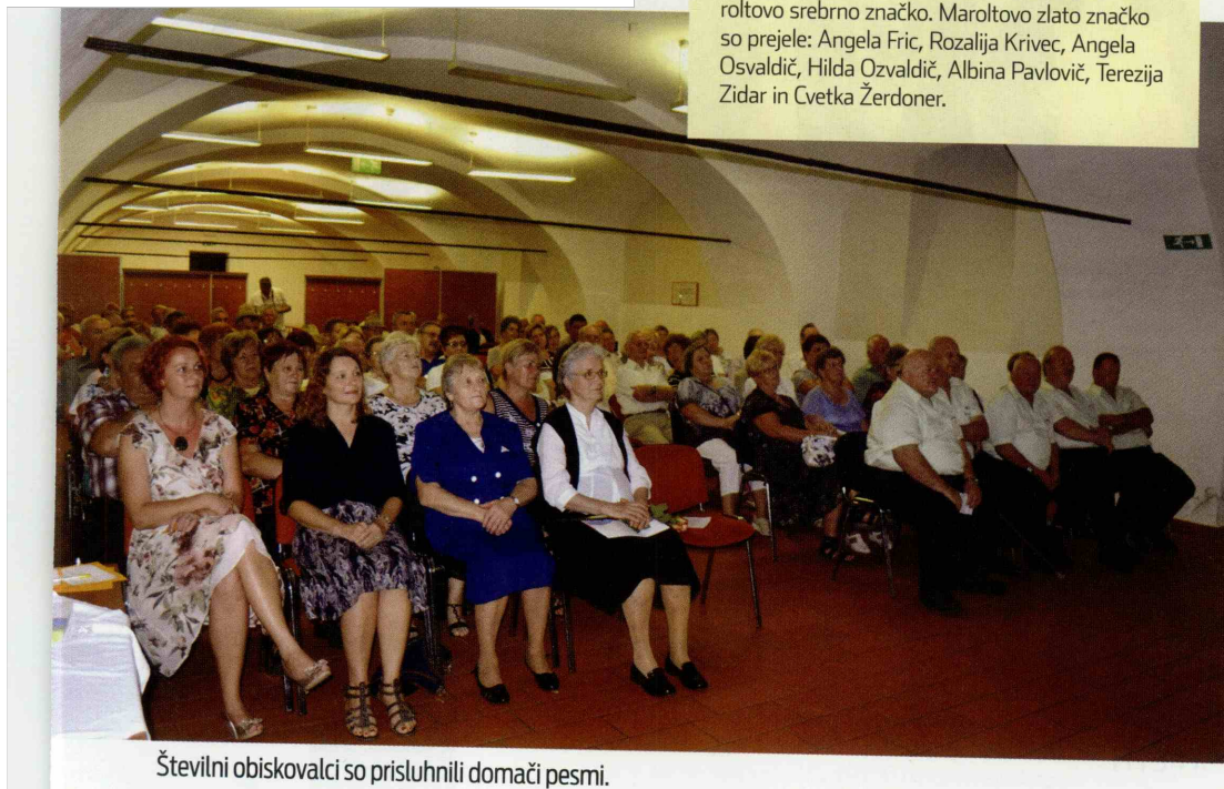
Številni obiskovalci so prisluhnili domači pesmi.