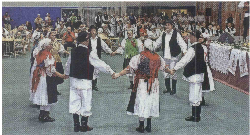
Na saboru hrvaške kulture v Škofji Loki je svoje slikovite folklorne plesse predstavilo več folklornih skupin.

Med gosti so bili tudi predstavniki hrvaškega ministrstva za kulturo in urada za Hrvate, ki živijo zunaj meja domovine, pa tudi Javna agencija Republike Slovenije za kulturne dejavnosti . Slednji namreč podpira tudi ljubljanske dejavnosti manjšinskih društev, s čimer zagotavlja ohranjanje njihove kulturne identitete in zagotavlja pestrost kulturne