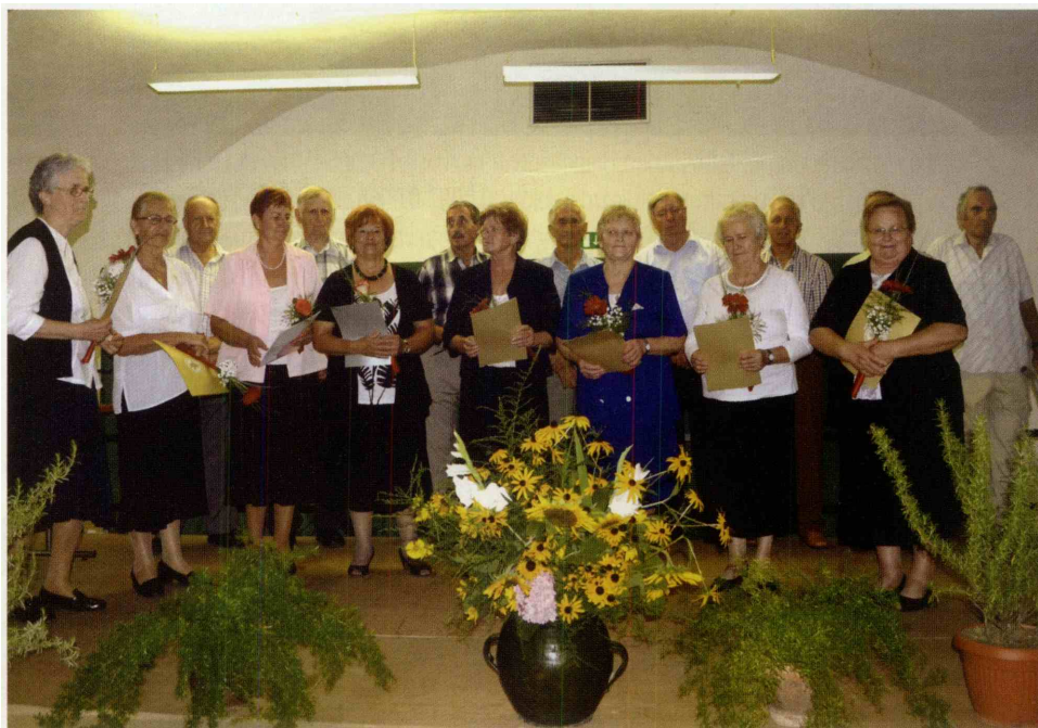
Ljudskim pevkam Rogatec (v prvi vrsti) so podelili Maroltove značke sklada.

V sklopu praznika Občine Rogatec so se v dvorani grajske pristave srečali ljudski pevci in godci.