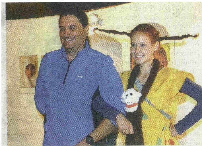
Pred tednom dni so na Velenjskem gradu odprli prvo od letošnjih Pikinih razstav, obiskovalce pa je prvič z obiskom razveselila tudi Pika.

Še vedno poteka fotografski natečaj na temo Barve poletja. Fotografije še vedno lahko pošljete po elektronski pošti. Novost je Pikin video natečaj, v katerega vabijo družine, da z mobilnim telefonom posnamejo, kako se pripravljajo na obisk festivala, in jim pošljejo posnetke.