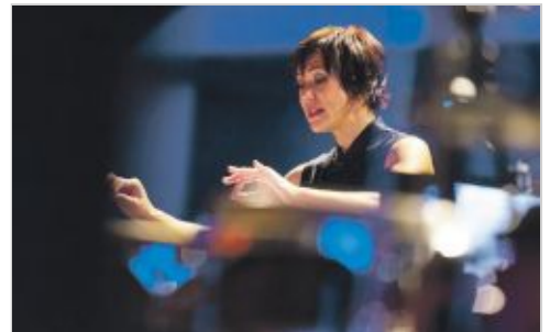
Letni koncert MePZ Viva - Preproste ljubezni, Terme Čatež, oktober 2014

Glasba torej. Zakaj prav glasba? Vaš oče tudi ceni glasbo, saj se z njo ljubiteljsko ukvarja že skoraj 50 let – še vedno kot ljudski pevec, do lani kot član Mešanega pevskega zbora KUD Oton Župančič Artiče. Ste bili tako v otroštvu »posvečeni« za glasbo in za glasbenico?