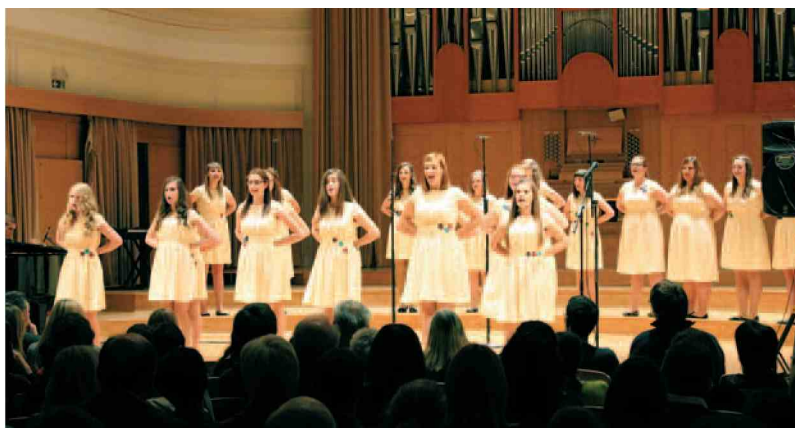
Dekliški pevski zbor Aglaja se je uvrstil na finalni koncert Sozvočenj in takole nastopil v Slovenski filharmoniji v Ljubljani.