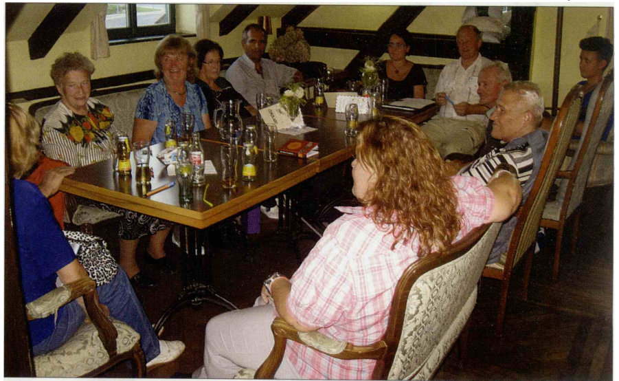
Člani Kulturnega društva Slap so se na delovnem srečanju dogovorili, da bodo tudi letos izdali knjigo, v kateri bodo zbrali svoje najnovejše literarno snovanje.