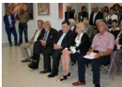
Častni gostje z avtorjem razstave.