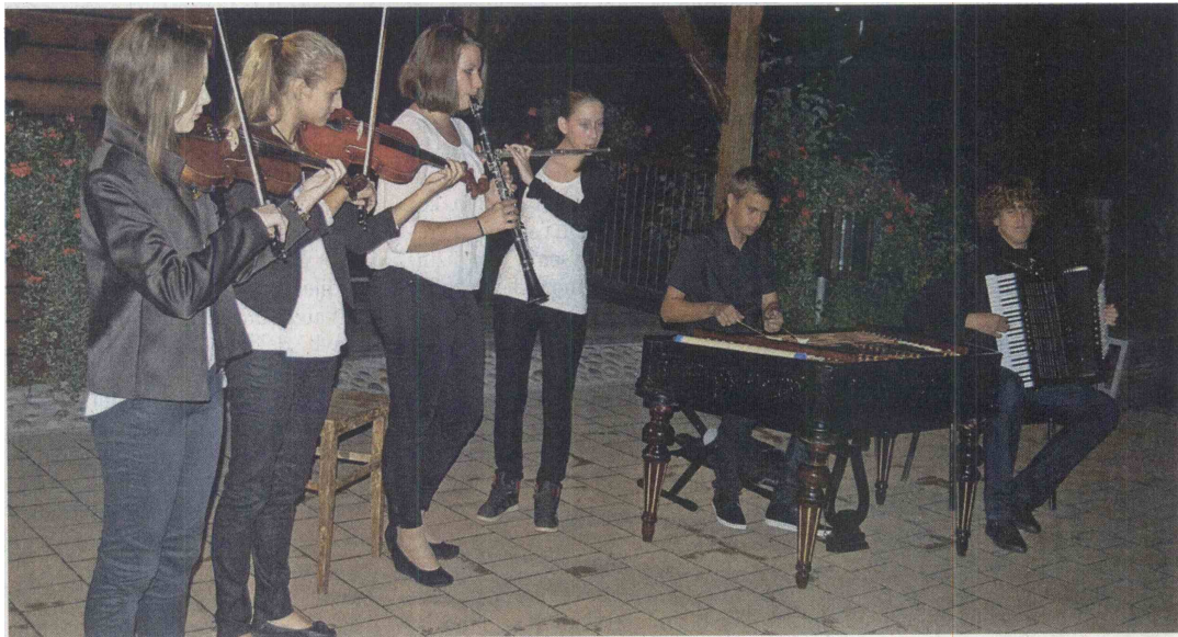
Na literarno-glasbenih večerih je nastopila tudi Prekmurka banda Glasbene šole Beltinci.