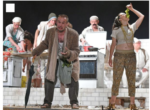
Aulularia, v kateri nastopajo člani skupine SKPD F.B. Sedej

Sedem najboljših slovenskih ljubiteljskih