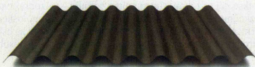
VALMETAL za naklone od 3° dalje