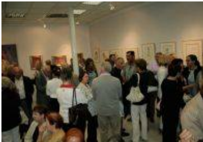
Odprija razstave se je udeležilo veliko število obiskovalcev.