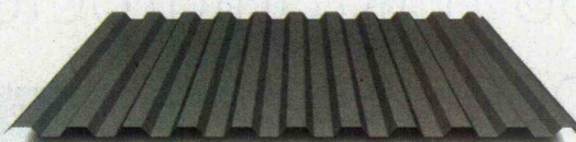
TP20 za stene in strehe