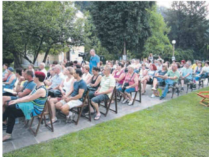
Šest predstav v krškem mestnem parku si je letos ogledalo okoli 400 obiskovalcev.