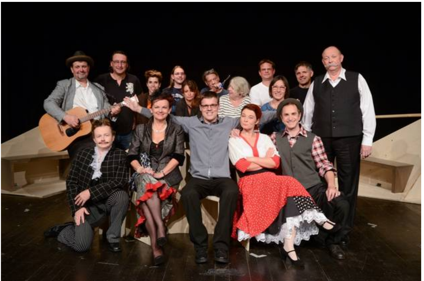
Igralski ansambel Šentjakobskega gledališča.