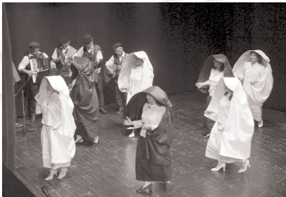
Folklorna skupina iz Malte na Miffu.