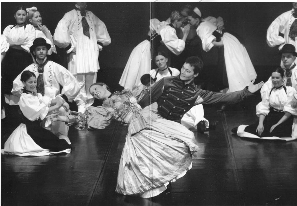
Utrinek iz folklornega baleta. (Povzeto po programski knjižici.)