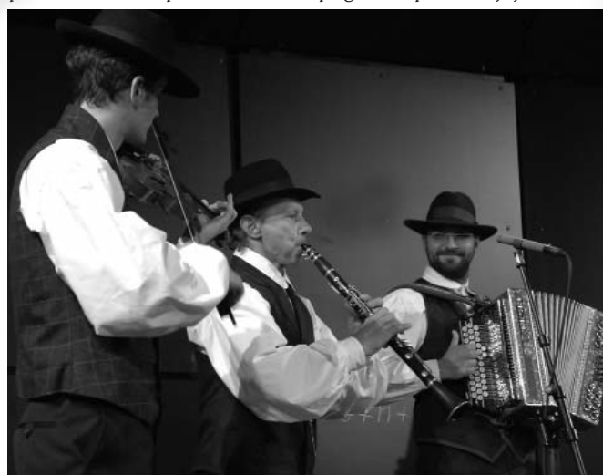
Nekaj godcev Akademske folklorne skupine Ozara Kranj. (, Pevci nam pojejo, godci pa godejo, Tolmin, 10. 11. 2007.)

Pri približevanju izvorni podobi v izvedbi plesnih viž so priredbe lahko pripomoček ali ovira, odvisno od izvajalca ... Za notalne izvajalce (torej tiste, ki znajo brati note), ki sicer ne živijo z ljudsko glasbo (največkrat v mestnih folklornih skupinah, kjer zasedbe godcev niti niso vedno enotne ali pa so odvisne od "substitutov", torej zamenjav, nadomestnih izvajalcev), je tovrstna pisna podlaga skorajda nujnost. Toliko bolj, kadar gre za glasbenike z manj razvito ustvarjalno noto. Po drugi strani se tovrstne skupine bolj opirajo na jasno določen scenarij. Zato je neka predvidljivost zelo zaželena. Gre tudi za skupine, katerih končni cilji se v marsičem razlikujejo od ljubiteljskih skupin v manjših krajih ali na vasi, kjer so praviloma bolj neposredno povezani z izročilom. Prej omenjene skupine, ki nastopajo na večjih prireditvah, festivalih in gostujejo v tujini, se pogosto prilagajajo zahtevam tujih "trgov", kajti vsa ta aktivnost je v teh primerih povezana z vrsto dejavnikov, ki še kako vplivajo na odsko poustvarjanje izročila. Gre za povezavo s politiko, gospodarstvom, turizmom kot delom gospodarskih aktivnosti, predstavljanje države v tujini, s športom kot delom reprezentativnosti države ... in za nekakšen statusni simbol. Ta je dostikrat v vlogi prikazovanja dela kulture ljudem, ki sicer o njej ne vedo veliko in zato lahko doseže učinek in cilj le s (vsaj delnim) prilagajanjem kriterijev okusu in zahtevam publike. Te skupine se v vseh pogledih približujejo načinu