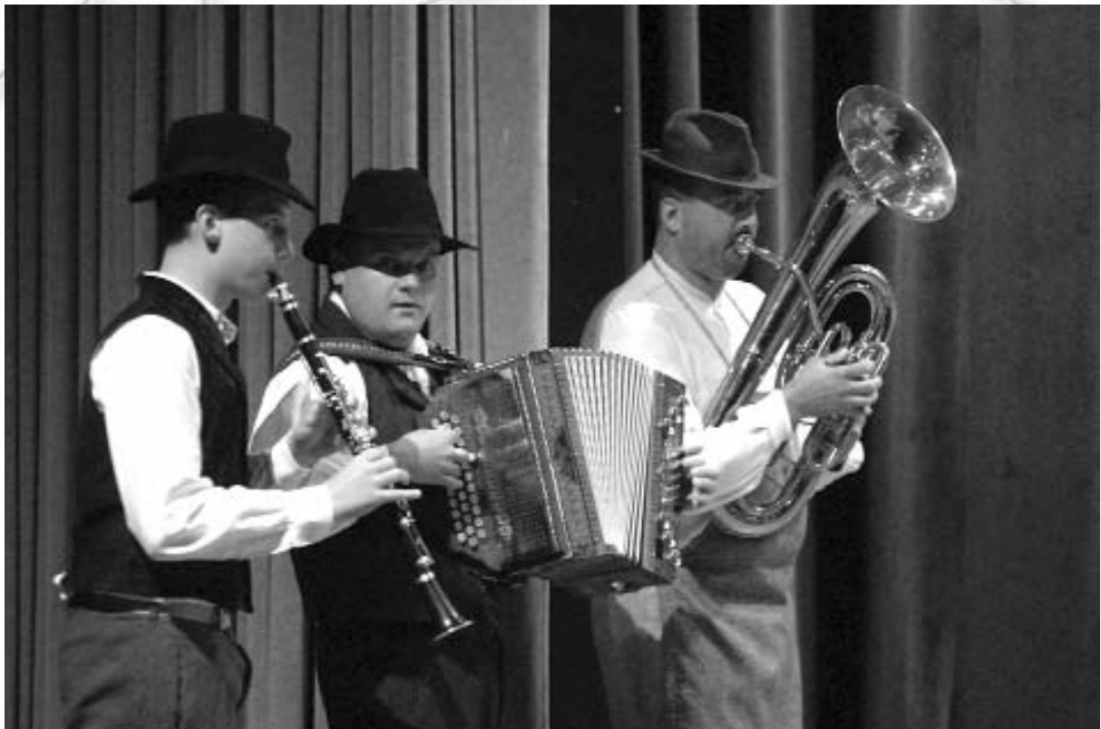
Mnogi zagovarjajo stališče, da glasbenih priredb ni treba pisati z notami na papir, ampak morajo nastati znotraj godčevskega sestava. To je priporočljivo zlasti pri folklornih skupinah, ki imajo stalen godčevski sestav in poustvarjajo predvsem izročilo svojega okolja. Na fotografiji so godci Folklorne skupine Kulturnega društva Luka Kramolc iz Šentanela. (, regijsko srečanje odraslih folklornih skupin, Rogaška Slatina, 30. 5. 2009.)

Prav za konec bi rada še enkrat poudarila, kako pomembno je, da so instrumentalisti folklornih skupin v dobri godčevski formi, da iščejo lasten godčevski slog, ki temelji na ljudski in ne narodno-zabavni ali klasičnoglasbeni izvajalski praksi. Če jim v priredbe – ne glede na to, po kateri poti so prišli do njih – uspe vnesti delček tistega, česar so se naučili od starih godcev ali z zvočnih posnetkov, če glasbilom pametno razdelijo vloge in linije, če vedo, da je notni zapis v knjigi zgolj eden izmed shematiziranih obrazov viže, so na dobri poti.