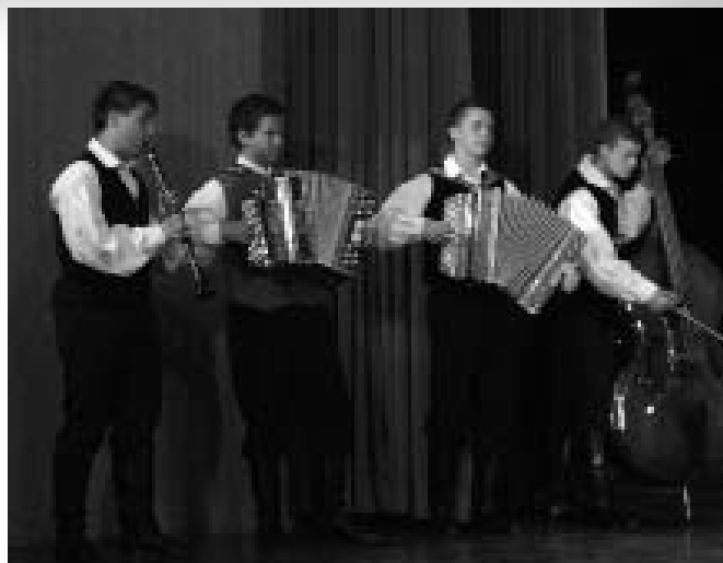
Dva godca na harmoniko v preteklosti razen res izjemoma nikoli ništa igrala hkrati. Danes se to dogaja zaradi razmer v folklornih skupinah, priprava priredbe pa je v takih primerih še posebno težavna. Na fotografiji so godci Otroške folklorne skupine KUD Oton Župančič iz Artič.

določene namenoma oblikovane tako, da se v njih zrcalijo slabosti, ki me kot poslušalko nastopov folklornih skupin najbolj motijo, druge pa predstavljajo boljše možnosti, ki nam jih ponuja godčevsko izročilo.