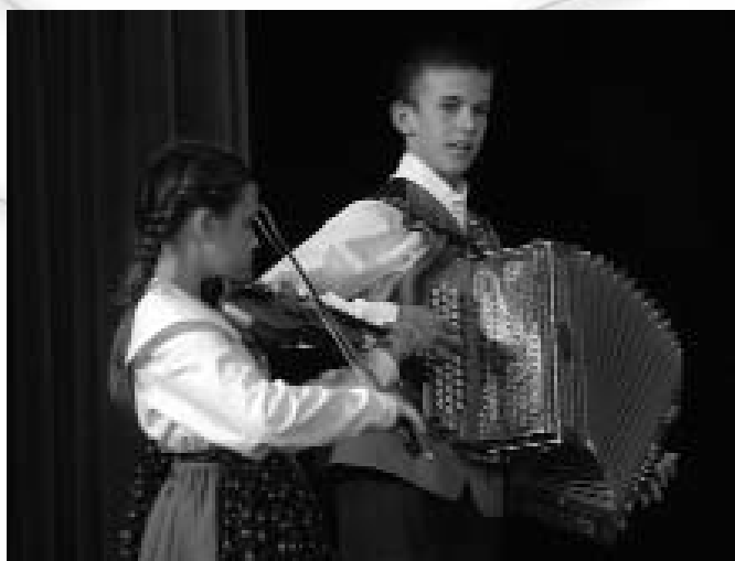
Vzgoja dobrih godcev se lahko začne že zelo zgodaj, glasbena priredba pa mora poleg splošnih zakonitosti upoštevati tudi zmožnosti otrok. Na fotografiji sta godca Otroške folklorne skupine iz Brežic.

Zaradi omenjenih razlogov sem se “priredbe” lotila na način, kot je predstavljeno v nadaljevanju. Seveda ne gre za pravo priredbo, saj posamezni deli niso povezani v smiselno celoto, niso predvidene ponovitve in podobno. Gre za več ločenih osemtaktnih priredb, od katerih so