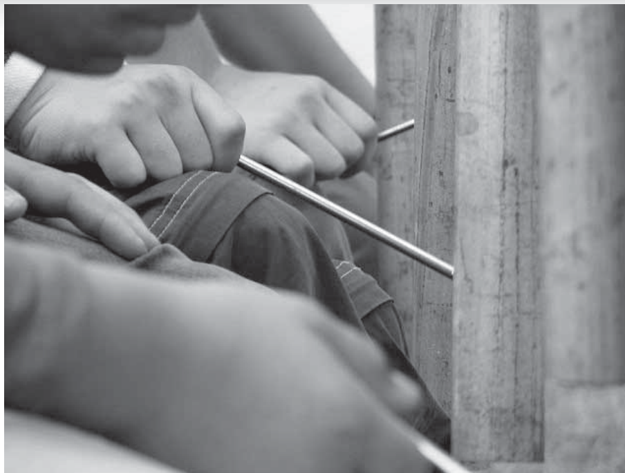
Vaja na cevi na pritrkovalski šoli.

Organizirane oblike pritrkavanja so organizacijsko ves čas prepuščene angažiranosti posameznikov, ki so del pritrkovalske dejavnosti, torej nosilec dejavnosti in ne strokovnim ustanovam. Cerkevni značaj pritrkavanja ter močna organiziranost pritrkovalcev je najverjetneje tudi eden od razlogov, da dejavnost v smislu spodbujanja kulturne ustvarjalnosti ter zagotavljanja strokovne in organizacijske podpore ni prešla pod okrilje Javnega sklada RS za kulturne dejavnosti. 6 Pritrkavanje je bilo delno zapostavljeno z vidika umeščenosti v ljudsko glasbeno ustvarjalnost. Tako se je Glasbenonarodopisni inštitut sistematičnemu zbiranju terenskega gradiva pritrkavanja posvetil po letu 1968, z etnomuzikološkega vidika pa je bil pojav obširneje obravnavan šele nedavno. 7