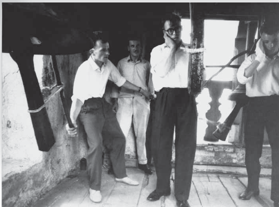
Pritrkavanje v Komendi. (, Komenda, 26. 5. 1968.)

Našteto organizirano delovanje, predvsem tekmovanja in šole, so spodbuda mlajšim pritrkovalcem, ki z veliko vnemo sprejemajo glasbilo kot glasbeno izrazno sredstvo, s katerim razvijajo glasbene spretnosti, sposobnosti in inovacije. Lahko povzamemo, da nastopanje pri pritrkavanju vpliva predvsem na tekmovalnost, konkurenčnost in potrebo po ovrednotenju; na spremembo estetskih vrednot (vizualnih in glasbenih); na izključenost širše skupnosti iz dejavnosti (predstavnitvo lokalne dejavnosti prevzame določena skupina, ki so bodisi talentirani ali kako drugače izstopajoči posamezniki); na izgubo obredne vloge; na časovno krajšanje in opuščanje določenih elementov iz tehničnih razlogov; na prilagoditev novemu prostoru in na spremembo v razmerju izvajalec – poslušalec. 5