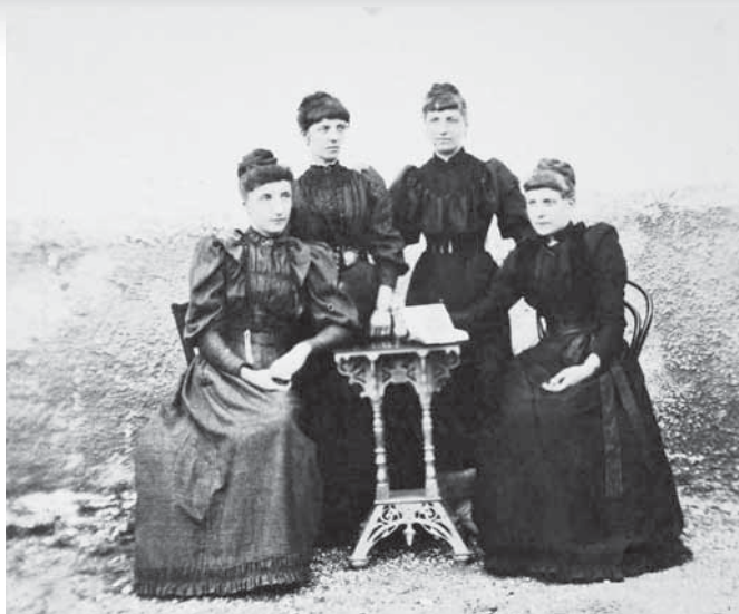
Slika 6: Fotografija s konca 19. stoletja.