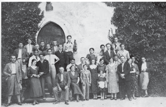
Slika 12: Glede na podatke o oblačenju, ugotavljam, da so v tem obdobju tudi na podeželju že povsem prevzeli poenoten način oblačenja ter sledili sočasnim modnim smernicam, čeprav ne v celoti. (Družba Slatinčanov na izletu, 30. leta 20. stoletja.)

Ideal lepote 30. in 40. let 20. stoletja je bil plečat, možat moški širokih ramen, kar so poudarjala tudi oblačila. Hlače so bile široke, prav tako reverji na suknjičih. Priljubljeni so bili telovniki in črtaste »gangsterske« obleke. Kot športno oblačilo so se uveljavile pumparice, vojaške hlače s škornji in kapice s šiltom. V času druge svetovne vojne je bila moda pod velikim vplivom vojaških uniform. Po vzoru vojaških pilotov so bili priljubljeni kratki suknjiči z zadrگو in usnjeni podloženi jopiči. Ženska moda je bila umirjena, zadržana in prefinjeno elegantna. Ideal je bila vitka ženska, s širokimi rameni in ozkim pasom. Krila so bila ozka in so segala do sredine meč. Marlene Dietrich je