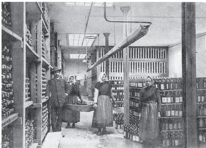
Slika 8: V podeželskem okolju so ženske prek bluz in jop proti mrazu ogrinjale še plete. To so bile iz volne pletene trikotne rute, ki so si jih ženske pogosto naredile same. Pred prvo svetovno vojno so bile priljubljene tudi okrasne naprsne rute, ki so si jih na prsih prekrižale in zataknale za predpasnik. (Delavci v polnilnici, izsek iz razglednice.)

V začetku 20. stoletja so ženske zraven krila na pas nosile še priležno krojene jopiče. Bluze so bile v 1. polovici 20. stoletja oblačilo mlajših žensk. Priljubljeni so bili tudi zgornji deli, ki niso bili ne jakna ne bluza. Takšni kosi so bili narejeni iz dveh delov. Osnova je bila kroj jakne oziroma bluže, odvisno od zelenega videza, kot dodatek pa so bili na sprednjem delu vstavljeni tako imenovani plastroni. To so bili vstavki, ki so dajali videz bluže, vendar niso bili krojeni v popolno bluzo. Takšni kosi oblačil so dajali iluzijo, da so ženske pod zgornjim kosom oblačil nosile še enega. Mlajše ženske so pred prvo svetovno vojno raje posegale po svetlejših barvah bluz in temnejših krilih, po njej pa je svetla bluza postala splošno sprejeto oblačilo. Že prej so bile bluže iz trpežnejših in cenejših materialov stalnica pri delovnih oblačilih.