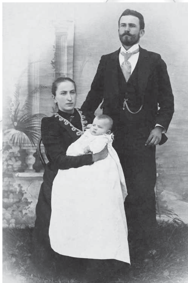
Slika 11: Tako kot dandanes je bila večina moških postrizena na kratko, tisti, ki so imeli dolge lase, so veljali za čudake. Moški so si svoje kratke lase česali ali nazaj ali na stran, redko na prečo sredi glave. Takrat so bili pri moških priljubljeni tudi brki, medtem ko so se po drugi svetovni vojni uveljavili kratko pristriženi. (Učiteljska družina, začetek 20. stoletja.)

Moški so najpogosteje nosili čevlje na vezalke, ki so segali malo nad gležnje. Čevlji, ki so jih nosili za vsak dan, so bili narejeni iz svinjskega usnja. Takšne čevlje so revnejši nosili tudi ob nedeljah, saj si boljših niso mogli privoščiti. Nekoliko boljši čevlji pa so bili iz boksa. Škornji naj bi bili v 19. stoletju splošno moško obuvalo, a v 20. stoletju po mnenju informatorjev ne več. Škornje so si namreč lahko privoščili samo premožnejši, saj so bili precej dragi.