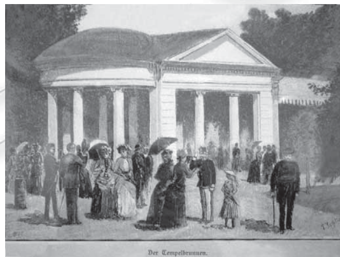
Slika 7: Pomembni moški modni dodatki so bili ura z verižico, manšetni gumbi, kravatne igle in sprehajalna palica. (Tempel nad vrelcem, F. Schlegel, okoli 1900.)

Pražnja obleka se od delovne ni bistveno razlikovala. Edina večja razlika je bila v blagu. Kroj je ostal enak, morda so si krila, ki so jih nosile vsak dan, nekoliko manj nagubala. Krila, ki so jih nosile ob delavnikih, so bila narejena iz trpežnega cajga 8 ali pa iz tankih potiskanih bombažnih tkanin, kot so cic, druk, kamerhut ali dilen (Sok 1991: 160).