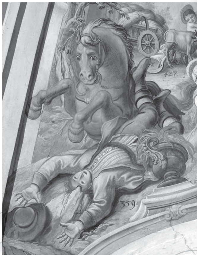
Slika 1: Na upodobitvah so naslikani tudi suknjiči, ki so od pasu navzdol krojeni navzven in imajo okrasno, nazaj zavihano manšeto, kakršna je bila v modi pri plemstvu vse od baroka. (Del freske v Marijini cerkvi na Sladki Gori (Makarovič 2007: 241).)

»J. C. A. von Fyrtag je l. 1753 napisal, da so moški južno od štajerske Drave nosili poleg slabih suknjičev zelo široke hlače, zelo kratke srajce, prevezane s pasom, in široke rjave ali rumene škornje. Ženske so poleti nosile popolnoma bele obleke in tako velike škornje kakor moški; v dežju so se ogrinjale v velike rjube; namesto z avbami so se pokrivalo z umetelno zloženimi rutami. Na celjskem območju so se nosili enako kakor drugod na Spodnjem Štajerskem, niso pa imeli tako širokih škornjev; ženske obleke so bile zelo drobno nagubane.« (Baš 1992: 128)