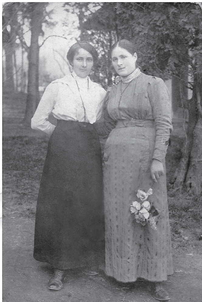
Slika 9: V 1. polovici 20. stoletja so imele ženske skoraj brez izjeme dolge lase. Te so si nato spletale v eno ali dve kiti, si jih ovile okoli glave ali pa zvile na temenu ali malo višje v figo. (Praznje oblečeni dekleti iz Cerovca pod Bočem; po prvi svetovni vojni.)

Najpogostejše praznje in delovno obuvale so bili visoki čevlji na vezalke s peto, imenovani punčuhi. Ti so bili narejeni priležno po nogi nekje do sredine meč ali malo nižje, vsekakor pa nad gležnji. Delovni čevlji so bili iz svinjskega usnja, medtem ko so bili boljši čevlji narejeni iz boksa 11 . Šele po prvi svetovni vojni so v navado prišli nizki čevlji s pasom.