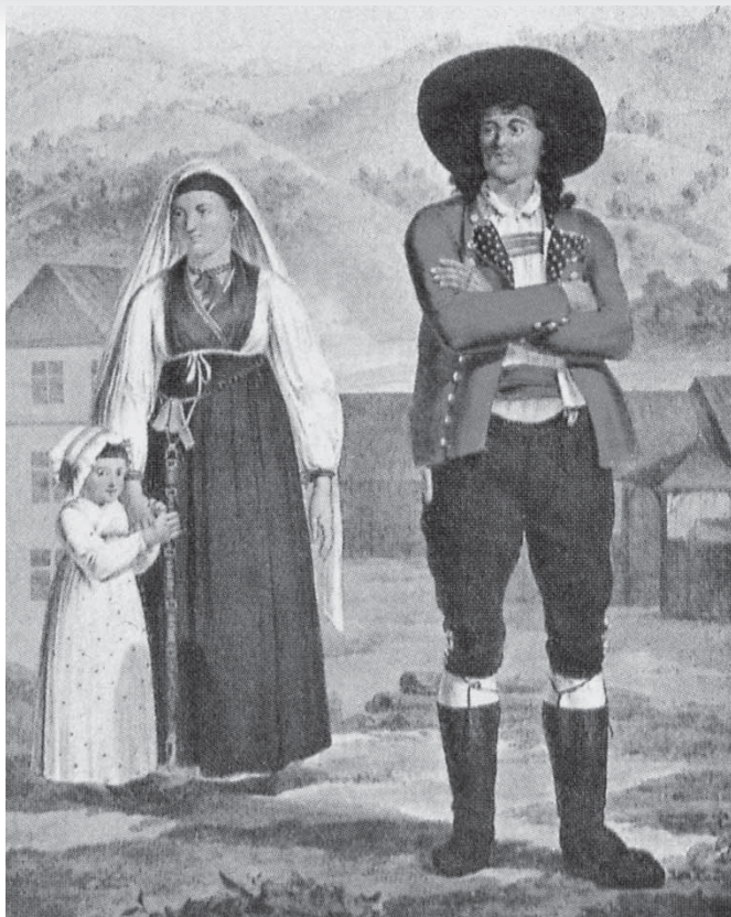
Slika 3: Takšen oblačilni videz se je ohranil najverjetneje nekje do 50. let 19. stoletja, nato pa so se začeli ljudje pod vplivom tedanje mestne mode oblačiti drugače. Poenotil se je kroj oblačil, ki so jih nosili, vendar je individualnost oblačilnega sloga ostala. (Slika kmeta s Spodnje Štajerske na meji s Hrvaško – med Rogatcem in Krapino. Karel Russ, 1811 (Geramb 1934: 229).)

Moško obleko je najpogosteje sestavljala bela srajca iz hodničnega platna, krojena s stoječim ovratnikom in ožjo obrobo, ki zaključuje rokavno manšeto. Pogoste so irhaste hlače. Na podlagi s Kranjskega ohranjenih irhastih hlač lahko primerjalno predvidevamo, da ima oprijeto krojena hlačnica spodaj ob straneh krajši razporek in na vsako stran po en ozek, večinoma črn ali rdeč trak za zavezovanje hlačnic. Spredaj je namesto hlačnega razporka na obeh zgornjih delih pravokotno vrezan kos blaga, ki se zapenja na vsako stran pasu z enim kovinskim gumbom. Lahko predvidevamo, da je bil osnovni kroj vseh podkolenskih hlač enak, četudi so bile narejene iz črno barvanega platna, sukna kakšne druge barve ali usnja. Telovnik je bil najpogosteje rdeče ali modre barve iz sukna ali flanele. Suknja škrlatno rdeče, lahko tudi modre barve je bila narejena iz sukna ali lodna. Plašč ni bil pogost del moške oprave. Sklepamo, da gre pri plaščih za modno, v času bidermajerja priljubljeno oblačilo, havelok, ki se je po šegi imenitnejših meščanov udomačilo tudi pri nekaterih vaških veljakihi. Moška oprava je vsebovala še rdečo opasnico, modre ali bele volnene nogavice, škornje in širokokrajni klobuk, pod katerega so nosili tudi čepice.