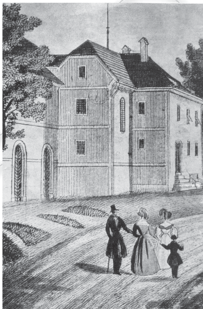
Slika 4: Na litografijah, ki prikazujejo zdravilišče Rogaška Slatina, vidimo goste, ki so oblečeni po sočasni oblačilni modi. Pri obeh spolih je bila modna silhueta peščene ure, kar so tako moški kot ženske dosegali z nošnjo korzetov. (Stara direkcija okoli leta 1840 (Vardjan 2004: 34).)

Ženske naj bi konec 19. stoletja (torej bi lahko rekli, da to velja za celotno 2. polovico 19. stoletja, op. p.) ob delavnikih nosile belo platneno ali pa barvano volneno krilo na pas, prek katerega so nosile še moder ali črn bombažen predpasnik. Zgoraj so nosile bele rokavce, prek njih pa »oprijeto jopo iz kambrika ali druka (kamertubasta kočemajka) modre barve« (Sok 1991: 146). Pogoste so bile pletene dokolenske nogavice iz sivkaste volne, ki so jih obuvale v visoke črne usnjene oprijete čevlje na vezalke. Kot pokrivalo so pogosto uporabljale »vzorčasto bombažno in pod