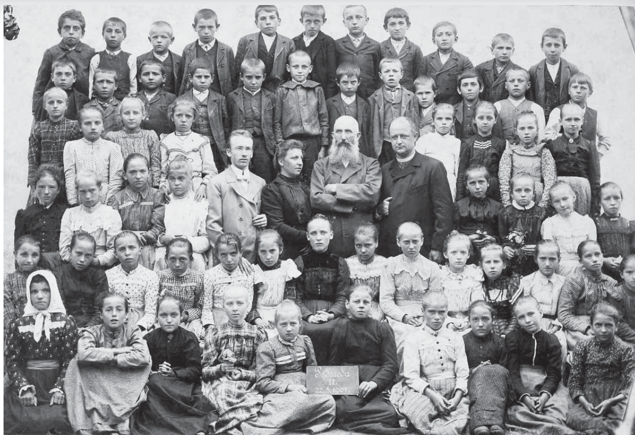
Slika 13: Fotografija šolarjev, 1901. (Iz arhiva avtorice prispevka.)

videvamo, da so oblačila, v katera so oblečeni ti otroci, boljša oziroma praznja. Delovna oblačila se verjetno niso kaj dosti razlikovala od teh na fotografijah, verjetno so bila bolj preprosta in narejena iz cenejših materialov. Fotografija nas tudi pouči, da so imeli fantje brez izjeme kratko postrizene lase, deklice pa so imele lase spletene v kito, ki so jo zvile na temenu.