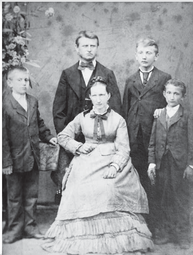
Slika 5: Fotografija družine, konec 19. stoletja.

Doslej edini meni znani fotografiji, ki izvirata iz proučevanega območja in sta iz 2. polovice 19. stoletja, kažeta nazorno podobo z gledovanja po sočasni oblačilni modi mestnega okolja. Na podlagi oblačil lahko sklepamo, da gre za premožnejše družine, ki so sledile sočasni modi. Na starejši fotografiji družine (slika