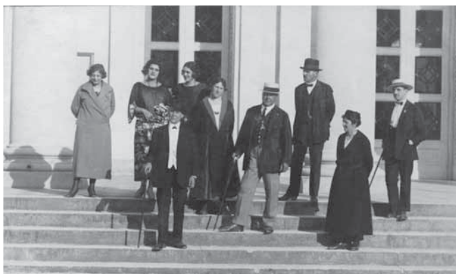
Slika 10: Oblačilna moda 20. let 20. stoletja je poudarjala ideal vitkega in ploskega deškega telesa, zato so bila ženska oblačila preprosto krojena, s poudarjeno vzdolžno linijo, pas pa je bil spuščen na boke, kar je zakrivalo naravne obline. (Gosti zdravilišča, fotografija, posneta leta 1924.)

V 20. letih 20. stoletja je moda narekovala oblačila, ki so prikrivala ženske obline, zato so bile priljubljene srajčne obleke, plisirana in nagubana krila asimetričnih dolžin, kostimi in športne pletenine. Rob kril se je v tistem času dvignil tudi do kolen. Kot modni dodatki so bile priljubljene dolge biserne ogrlice, rokavice, šali in cigaretni ustniki.