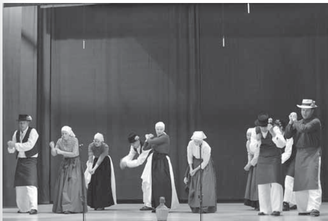
Folklorna skupina Turistično-kulturnega društva Ivanjkovci na regijskem srečanju odraslih folklornih skupin.

Vodje folklornih skupin pripravljajo različno dolge in različno zahtevne programe. Pogosto pripravljajo kratke, navadno manj kot deset minut dolge odrske postavitve, ki predstavljajo skle-