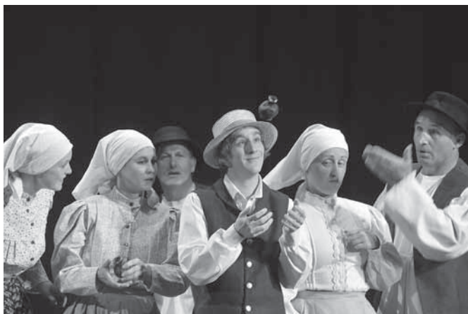
Folklorna skupina Kulturno-umetniškega društva Triglav s Slovenskega Javornika na regijskem srečanju odraslih folklornih skupin.

Za vsako ljubiteljsko skupino, vsekakor tudi za folklorno je pomembno, da so ljudem, ki so v skupino vključeni, vloge razdeljene tako, da izkoristijo čim več njihovih sposobnosti. Predvsem ni dobro, da se vloge delijo že vnaprej, še preden je program dokončno oblikovan. Razdeljevanje vlog je namreč odvisno od sestave skupine, pri postavljanju programa pa je pomembno, da začnemo z vajami situacij. Člani skupine naj se igrajo posamezne prizore, naj preizkušajo možnosti, se življajo v like, iščejo rešitve ... Naj ne delajo programa, ki ga ima režiser v glavi, ampak naj delajo stvari, ki so temu programu blizu.