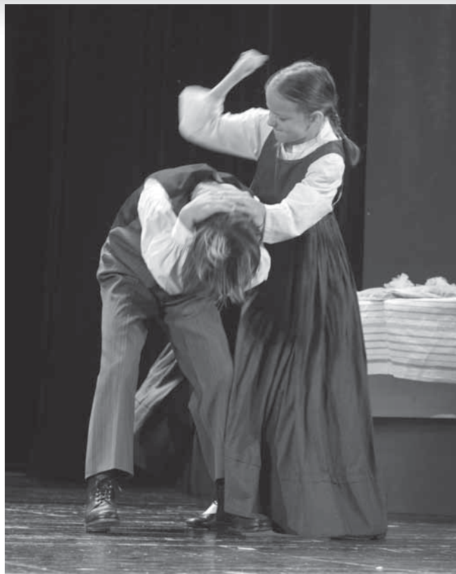
Člana otroške folklorne skupine Kulturnega društva Prežihovci z Osnovne šole Prežihovega Voranca iz Maribora na regijskem srečanju otroških folklornih skupin.

Rezultat: V tem primeru bodo nastopajoči veliko izraziteje doživeli prizor, dogajanje pa bo živahno, sproščeno in bolj »naravno«.