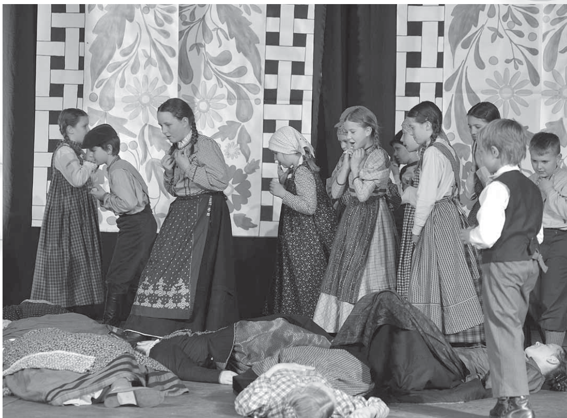
Otroška folklorna skupina Lončki iz Dolenje vasi na regijskem srečanju otroških folklornih skupin.

Zavedati se mora, da vedno obstaja most med idealno predstavo – režiserjevo zamisljivo – in resnično uprizoritvijo. Zato njegova naloga ni, da nekritično vsiljuje svoje zamisli, kajti v tem primeru bo odrska postavitve težko resnično zaživela, ampak da z delom, ki ga ves čas usmerja, usklajuje svoje želje in zamisli z ustreznimi motiviranimi člani folklorne skupine. Most med idealno predstavo in resnično uprizoritvijo naj ne bo predolg, predvsem pa naj bo dovolj trden, da se ne bo prehitro porušil.