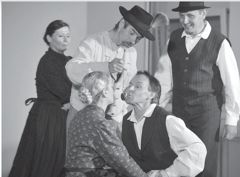
Folklorna skupina Rej iz Šmartnega pri Slovenj Gradcu na regijskem srečanju odraslih folklornih skupin.