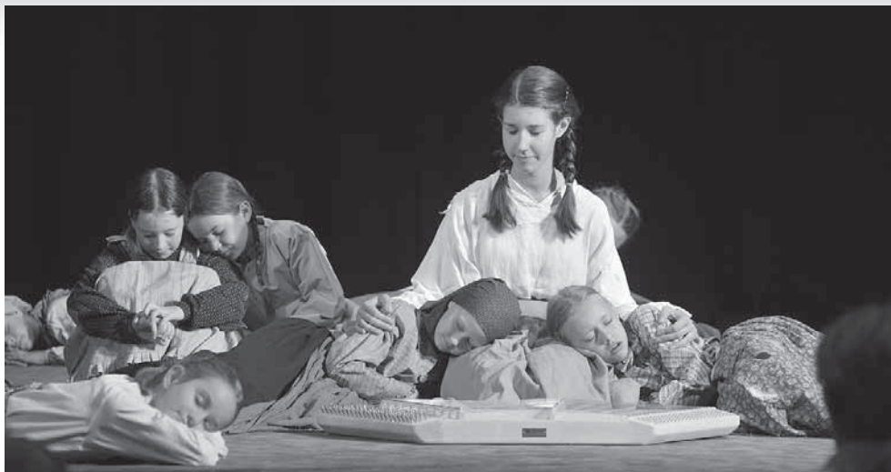
Otroška folklorna skupina Karavanke na regijskem srečanju otroških folklornih skupin. (, Bohinjska Bistrica, 15. 5. 2011.)

ustrezen zaključek, saj onemogoči, da bi bil zadnji razumljen, če pa ta počaka, da ljudje aplavz prekinejo, je stvar že končana in potem ponovno začeta. V nobenem primeru to ni dobro, zato bi se veljalo iskanjem takih zaključkov odreči.