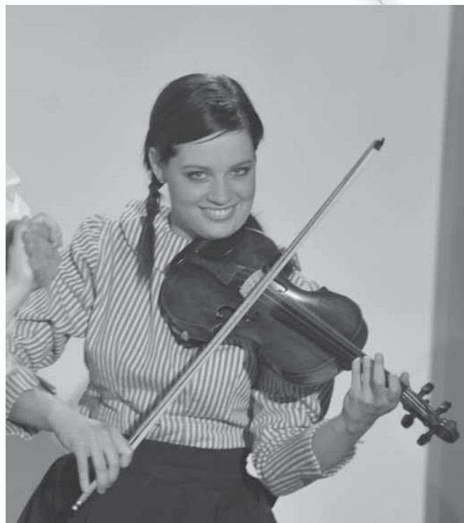
Violinistka Folklorne skupine Kulturnega društva Anton Stefanciosa iz Rogatca na regijskem srečanju odraslih folklornih skupin.

Prav tako so vedno znova zanimiva povezovanja sodobnosti in preteklosti, ki se kažejo tako pri delovanju otroških kakor odraslih folklornih skupin. Tovrstni prikazi, vsaj kolikor mi jih je uspelo videti, prinašajo nova sporočila, so vzgojni in nevsiljivo ponujajo primerjavo.