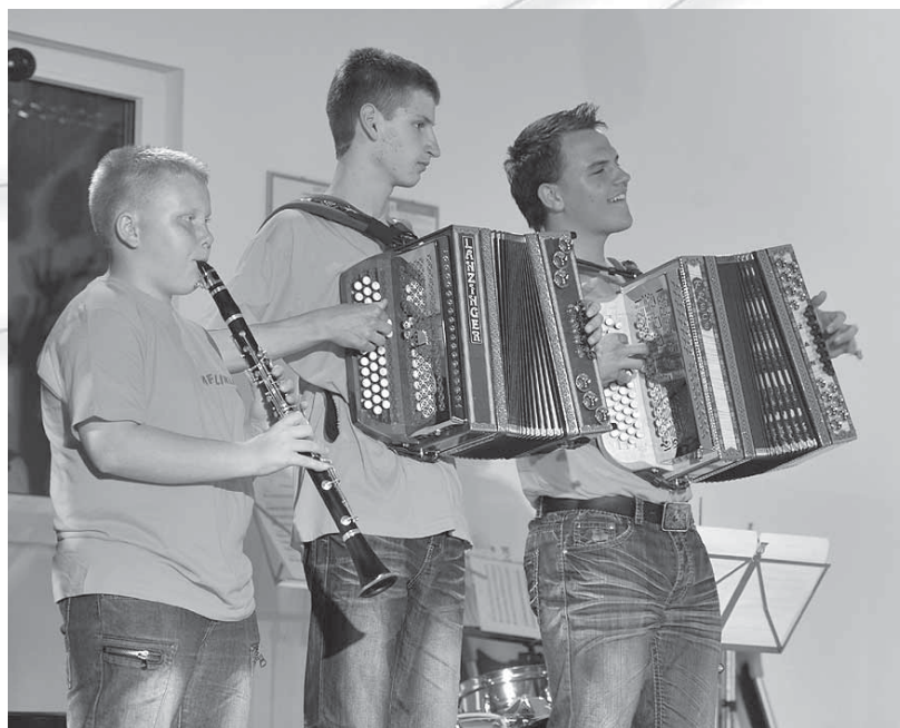
Člani mladinske folklorne skupine na regijskem srečanju odraslih folklornih skupin v Blagovni, vključeni v zanimivo povezovanje.