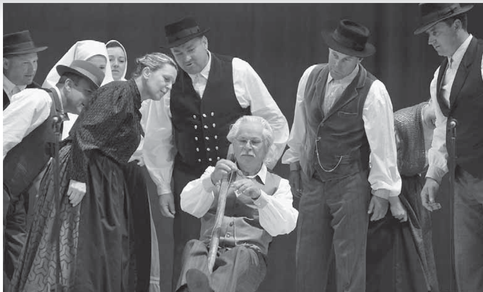
Starejša folklorna skupina Folklornega društva Lancova vas na regijskem srečanju odraslih folklornih skupin.