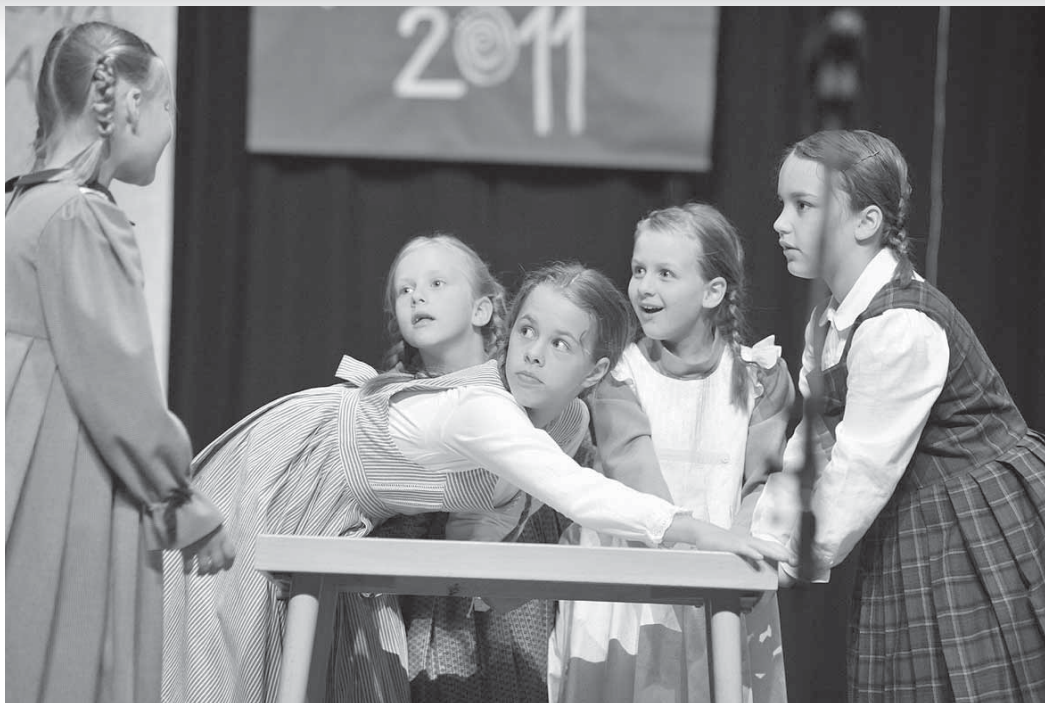
Otroška folklorna skupina Domžale na državnem srečanju otroških folklornih skupin.

bodo člani skupine bolj zavedali, kje so njihove šibke točke, kje je treba stvari izboljšati in kako do višje kakovosti. Z analizo, na kateri izpostavite tako pozitivne kot negativne stvari, sklenite tudi vsak nastop.