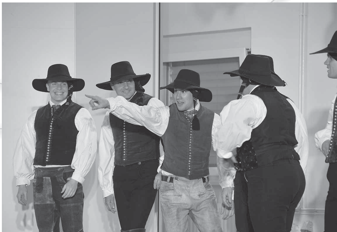
Fantje folklorne skupine Šaleškega folklornega društva iz Velenja na regijskem srečanju odraslih folklornih skupin.