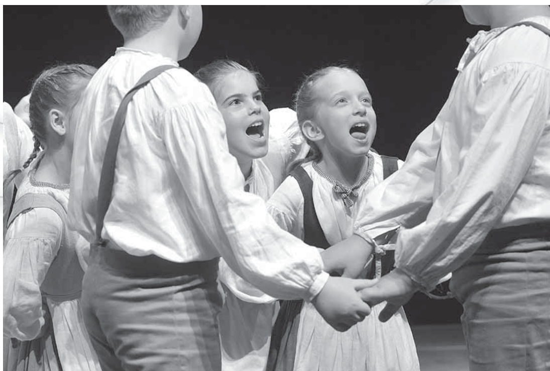
Otroška folklorna skupina osnovne šole Šentjernej na regijskem srečanju otroških folklornih skupin.

Prav bi bilo, da na vajah, zlasti ko se te bližajo cilju, nekaj minut posvetite celostni analizi programa, ki ga pripravljate. Tako se