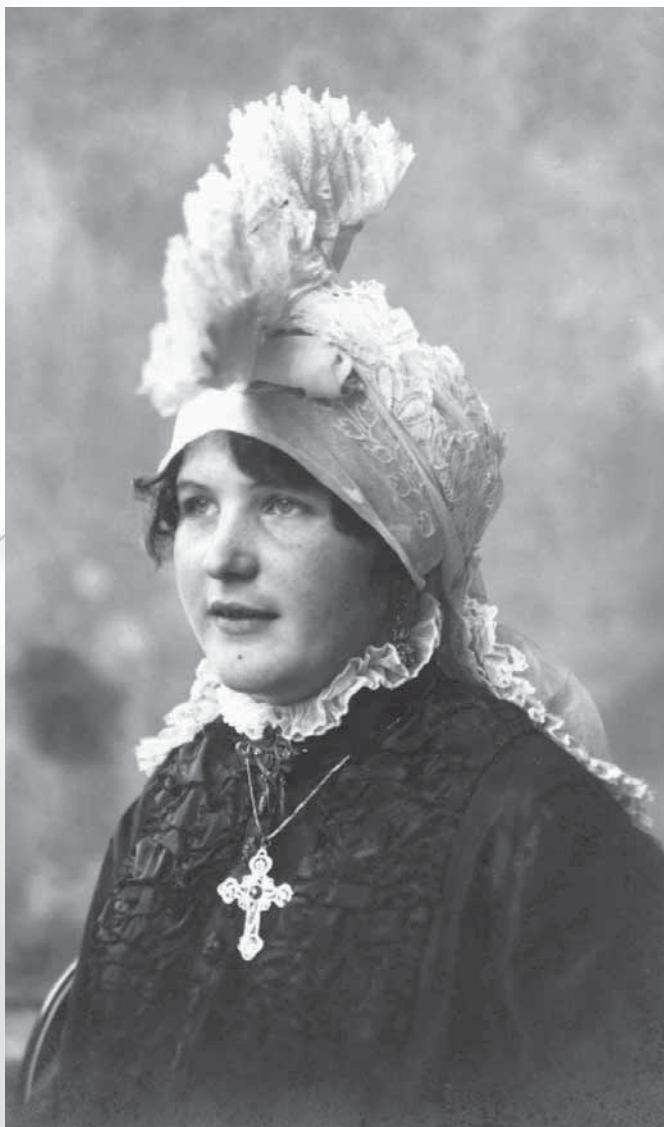
Na petelinčka zavezana peča, pri kateri je jasno vidna prednja zanka, na katero je pritrjen »petelin«. (Fotografija je iz zbirke Slovenskega etnografskega muzeja; Paladin 2007: 26.)

Izjemoma so to vezavo ohranili tudi v času sekundarne folklorizacije tovrstne vezave. Ponekod so do danes ohranili zavezovanje na eno zanko, na katero so pritrčili vogal s čipkami, večinoma pa prevzeli način vezave z mediteranskega oblačilnega območja, pri katerem se vrh glave naredi vozec – za potrebe petelinčkove vezave navadno enojni –, potem pa so vogala oblikovali tako, da je nastal peteličkovi vezavi podoben greben. Navadno so prednji vogal pomaknili nazaj in zadnjega naprej, in sicer tako, da so bile čipke na gornji strani, in potem oba dela na podlago, ki je ne tvorita zanki, ampak peča sama, pritrčili z bucikami. Nekateri so vogala oblikovali v bolj urejeno in ožjo rožo, drugi pa v manj urejeno in širšo strukturo.