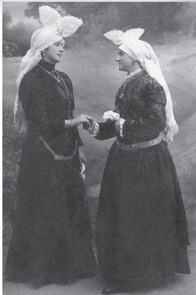
Ženski s pečama, fotografirani v Mostah pri Ljubljani leta 1895. (Paladin 2007: 21.)

da gre za slovesno preobleko, s katero je poudarjena pripadnost slovenstvu, tudi pripadnost lastni rodbini, družinski dediščini in okolju, iz katerega nosilec izhaja, ter v gorenjskem pripadnostnem kostumu oziroma »gorenjski noši«, ki se je v različicah s pečo, z avbo z vrhom ali z zavijačo že v 19. stoletju razvila v enega od simbolov slovenstva. V 19. stoletju so peče sorazmerno pogosto dopolnjevale gorenjski pripadnostni kostum, v 20. stoletju pa so jih skoraj docela izpodrinile avbe z vrhom in zavijače, tako da