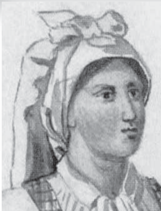
Goldensteinova upodobitev Notranjke iz leta 1838. (Makarovič 1970: 66.)

Če iz Goldensteinovih upodobitev ni najbolj jasno, kako je tvorjena pentlja, je to nekoliko bolj iz dveh upodobitev Matevža Langusa s Šmarne gore, ki sta nastali v letih 1846/47. Zаметki petelinčkove vezave, ki izhaja iz zavezovanja na pentljo, sta razvidni pri dveh ženskah, pri katerih je v trikot preganjena peča prekrižana na zatilju in zavezana vrh glave na način, ki ga kažejo rekonstrukcijske fotografije. Na zatilju je vogal, ki gre spodaj, enkrat ali dvakrat zasukan, s čimer je zatrjen položaj vogala, ki pada na hrbtu.