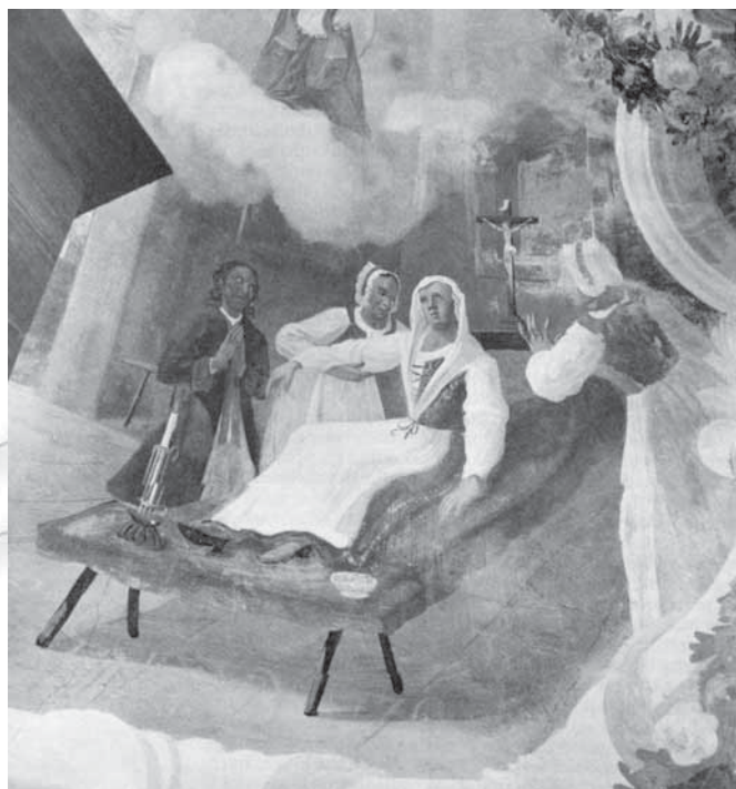
Upodobitev, na kateri ima ženska v sredini prek avbice preprosto položeno v trikot preganjeno pečo. Daljša vogala ji padata prek prsi in sta zataknjena za pas. (A. Tušek, Kmetice , Vesela gora pri Šentrupertu na Dolenjskem, 1760; Baš 1992: 151.)