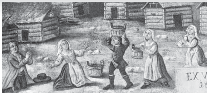
Votivna podoba z Blečjega vrha iz leta 1804, iz katere je razvidno, da imajo ženske glavo pokrite s pečo, ki je preganjena na trikot, vogala, ki bi sicer padala na prsi, pa sta preganjena prek temena. (Makarovič 1970: 62.)