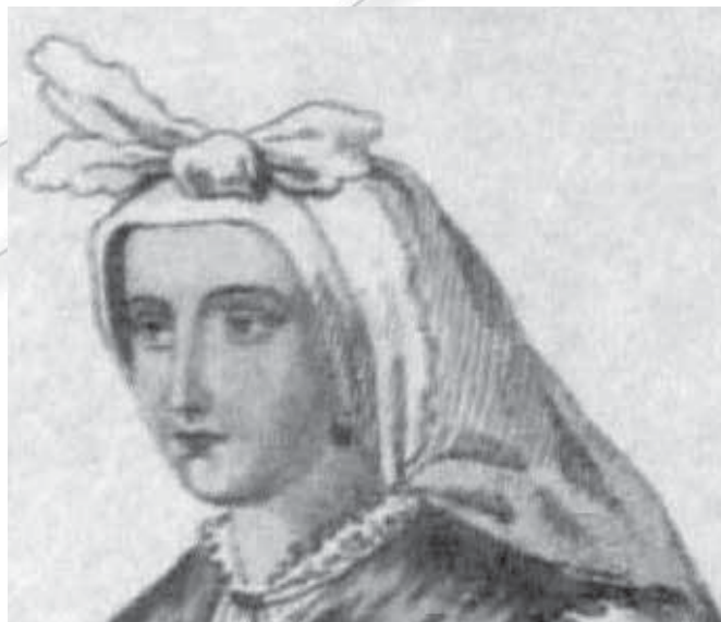
Upodobitev Škofjeločanke slikarja Karla von Goldensteina iz leta 1838. (Stopar 1993: 89.)

Omenjeni upodobitvi zavezovanja peč s Šmarne gore in iz Begunj na Gorenjskem sta žal premalo jasni, da bi bilo mogoče natančno vedeti, kako sta bila vogala zavezana vrh glave. A če upoštevamo, da je bilo na mediteranskem oblačilnem območju in na območjih, ki so mu bili blizu, pogosto zavezovanje v vozel , v osrednji Sloveniji pa v pentljo (več glej Makarovič 1964: 299–305, 1970: 61–83), in če se na tem mestu ukvarjamo z vprašanjem razvoja petelinčkove vezave, ki se je najintenzivneje razvila prav v osrednji Sloveniji, potem nam mora biti jasno, da se je petelinčkova vezava razvila iz zavezovanja v pentljo in ne iz zavezovanja v vozel, ki se ga danes napačno poslužujejo mnogi pri petelinčkovi vezavi. Zavezovanje v pentljo je upodobil slikar Karl von Goldenstein pri Škofjeločanki, čeprav vozla ni najbolj natančno naslikal, zaradi česar zgolj iz te upodobitve ni mogoče vedeti, kakšna bi bila vezava v pentljo. Je pa iz upodobitve razvidno, da ima ženska na vsaki strani vozla po dva »krajca«. Po nekaj let mlajšem gradivu je mogoče tudi za to upodobitev ugotoviti, da se ob vozlu vrh temena na vsaki strani vidi po ena zanka in en vogal – vidi se torej pentlja.