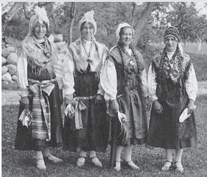
Pripadnostno kostumirana dekleta iz okolice Bleda v času med obema svetovnim vojnama. Dve imata na glavi pečo, zavezano na petelinčkovo vezavo, a »petelin« ni ne visok, ne pretirano urejen.