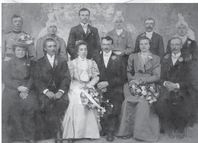
Poročna fotografija iz Horjula iz časa pred prvo svetovno vojno. Tri ženske na fotografiji so oblečene po tedanji oblačilni modi, na glavi pa imajo pečo, zavezano na petelinčka.