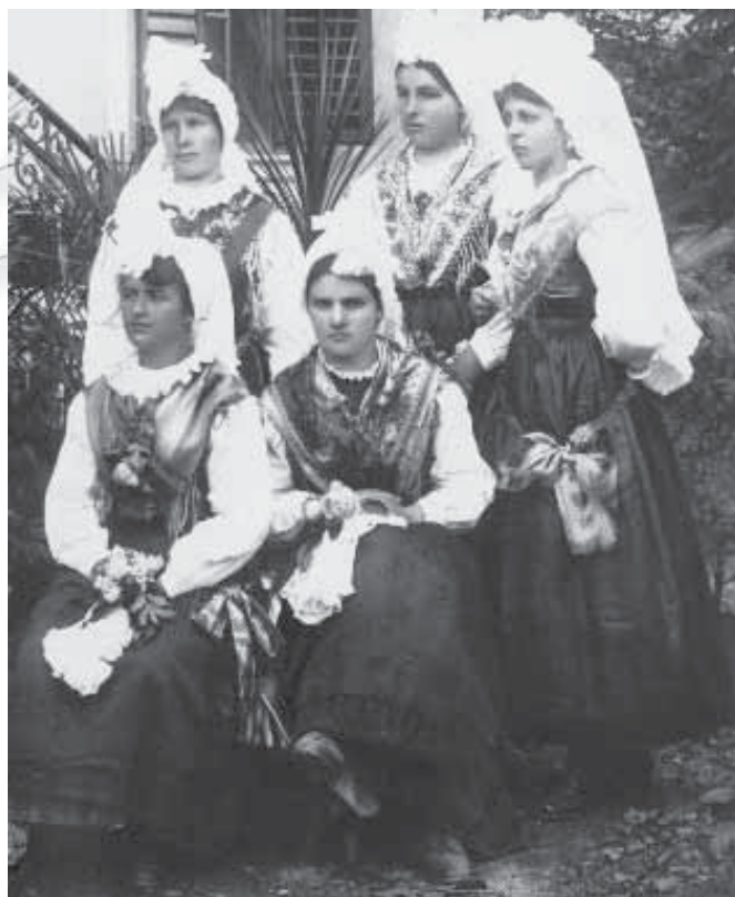
Pripadnostno kostumirana dekleta iz okolice Bleda s pečami, katerih petelini so precej razmršeni, v času med obema svetovnimi vojnama. (Iz arhiva avtorja prispevka.)

V nekaterih folklornih skupinah in pri nekaterih posameznikih se je v zadnjih desetletjih 20. stoletja uveljavil način, da po prekrizanju peče na zatilju, vogala, ki sta zavezana vrh glave pred tem ovijajo. Pri tem ovito blago obkroža obraz, kar ni v skladu s pričevanji iz 19. stoletja, ko to ovijanje skoraj nikjer na Slovenskem ni izpričano. V folklornih skupinah se je splošno uveljavilo pri zavezovanju peč, kakršne naj bi nosili na Primor-