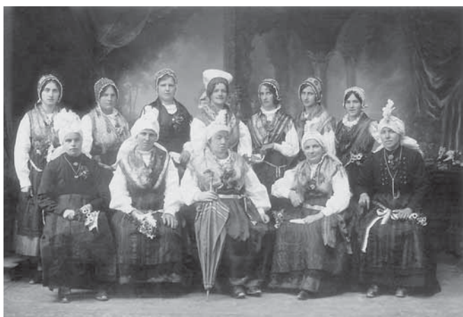
Pripadnostno kostumirane ženske okoli leta 1930. (Paladin 2007: 19.)