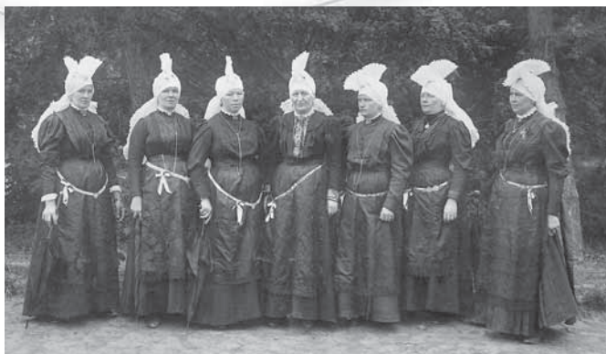
Ženske iz Ljubljane v »črnih nošah« leta 1908. (Paladin 2007: 4.)

Peče so torej že v 19. stoletju sodile h gorenjskemu pripadnostnemu kostumu, tudi k »črni noši«, ki se je razvijala na Gorenjskem in drugje na alpskem oblačilnem območju, a pogosto je bil njihov videz drugačen, kot so ga dajale peče pripadnostno kostumiranih Ljubljančank. Ali je bil edini vzrok za manj urejen videz petelinčkove vezave v tem, da so ženske zaradi skromnejših