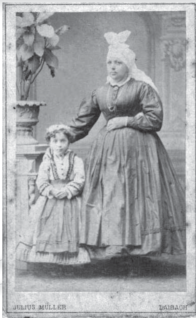
Fotografija Mengšanke z otrokom s konca 19. stoletja. S fotografije je razvidno, da sta vogala, ki tvorita petelinovo rožo, pritrjena na zračno podlago, ki petelina izrazito poviša.