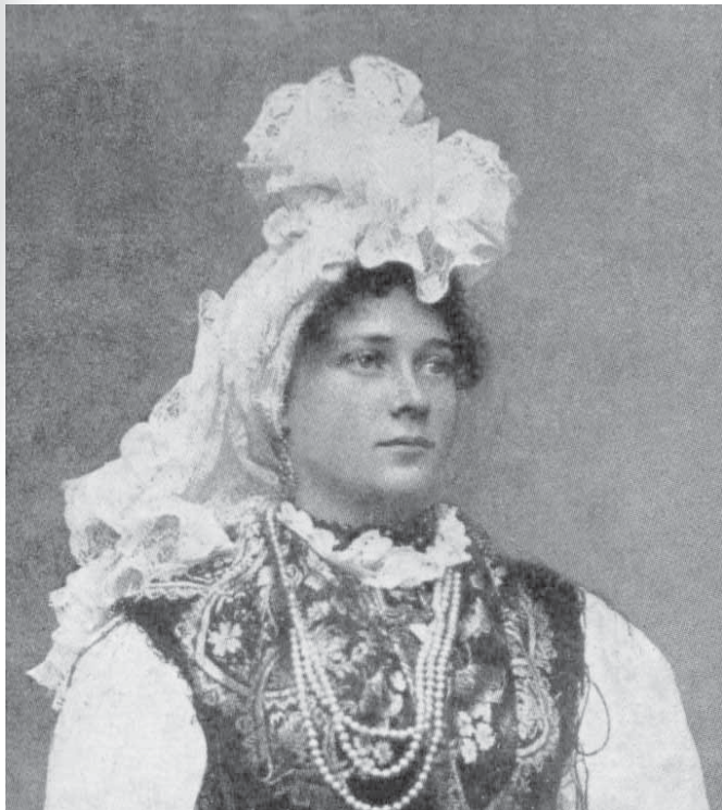
Razglednica s konca 19. stoletja.

življenjskih razmer zunaj mestnih okolij veliko težje zagotovile visoko in umetelno vezavo, je danes težko reči, vsekakor pa je dejstvo, da so bili »petelini« pogosteje kot v mestnih okoljih manj ravno in visoko urejeni, hkrati pa ponekod očitno tudi namenoma »razmršeni« in oblikovani brez predhodnega kolmanja.