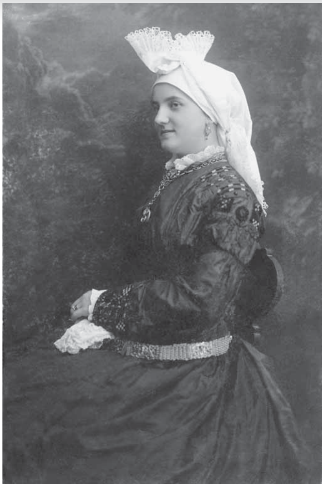
Peča iz bombažnega blaga platnene vezave, zavezana tako, da sta vogala s čipkami pritrjena na podlago, ki jo dobimo z vezavo na pentljo. (Fotografirano v Mostah pri Ljubljani leta 1895. Fotografija je iz zbirke Slovenskega etnografskega muzeja; Paladin 2007: 11.)