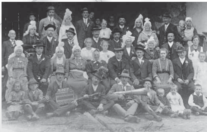
Fotografija izpred prve svetovne vojne. Ohcet v Dolini nad Trzičem. (Iz arhiva avtorja prispevka.)