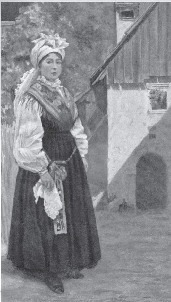
Razglednica iz serije Avstro-ogrski narodni tipi .

uveljavil zaradi sorazmerne preprostosti, zaradi vpliva vezanja peč na mediteranskem oblačilnem območju, zaradi pomanjkanja znanja ali pa zaradi dejstva, da so ohranjene ali na novo izdelane peče za petelinčkovo vezavo premajhne.