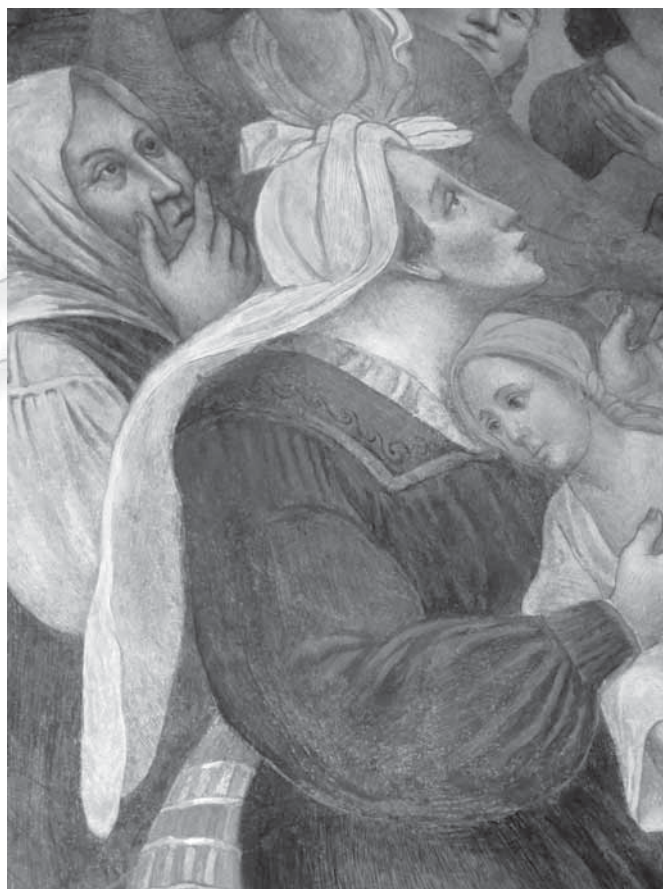
Ženska s pečo na freski v cerkvi Marijinega oznanjena v Ljubljani.