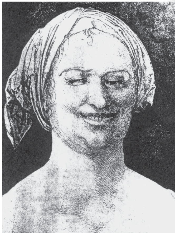
Albrecht Dürer, Portret Rezijanke ali Korošice iz Kanalske doline s turbanasto povito pečo. (Makarovič 2008: 89.)

Gotske peče naj bi bile pravokotne in na glavo preprosto položene, tako da sta konca padala čez rame. V 15. in 16. stoletju se med kmečkim prebivalstvom uveljavijo v trikot položene kvadratne peče, ki so jih kmetice preprosto polagale na glavo, znano pa je bilo tudi turbanasto zavijanje peče okoli glave.