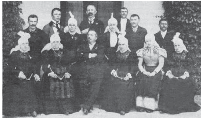
Cerkveni in čitalniški pevski zbor v Šentvidu nad Ljubljano leta 1898. (Ilustrirani Slovenec 1926: 157.)