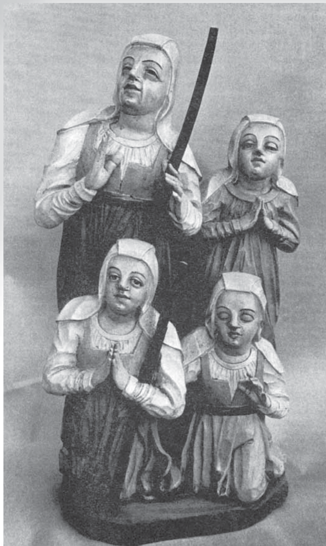
J. Korneli, Slepe ženske , Dražgoše, 1658. (Hrani Loški muzeji v Škofji Loki; Baš 1992: 39.)

le načini polaganja, zavezovanja in gubanja so se spreminjali. V 1. polovici 19. stoletja se je močno uveljavilo pokrivanje na način, da je bila v trikot in čez podpokrivalo položena peča pod brado prekrižana in zavezana vrh zadnjega vogala na zatilju ali temenu, po likovnih virih sodeč pa so bili uveljavljeni tudi drugi načini. Veliko o njih je mogoče prebrati v različni literaturi (glej npr. Makarovič 1964 in 1970; Žagar 2004), zaradi česar menim, da ponavljanje na tem mestu ni potrebno.