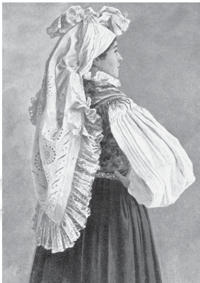
Razglednica iz serije Avstro-ogrski narodni tipi .

skem, kakor tudi pri zavezovanju peč, ki naj bi sodile k metliškemu in gorenjskemu pripadnostnem kostumu ter drugje. A poudariti je treba, da gre pri tem za nov – s pripadnostnim kostumiranjem in s kostumiranjem folklornih skupin povezan pojav. Pri zavezovanju peč na petelina se je pri mnogih skupinah splošno uveljavil način vezave, pri katerem se vogala zavežeta na enojni vozle na vrhu glave, potem pa se iz vogalov, ki ostanejo, oblikuje petelin. Ta način tvorjenja petelinove rože se je po vsej verjetnosti