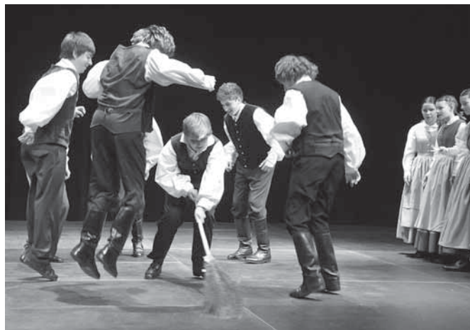
Otroška folklorna skupina Kulturno-umetniškega društva Oton Župančič iz Artič na regijskem srečanju otroških folklornih skupin.