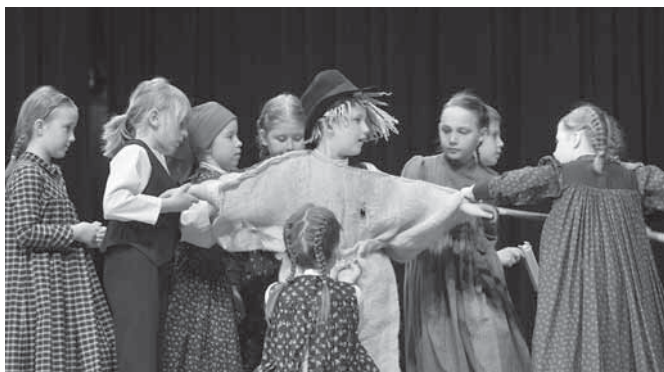
Otroška folklorna skupina Kresničke Osnovne šole Gustava Šiliha iz Velenja na regijskem srečanju otroških folklornih skupin.