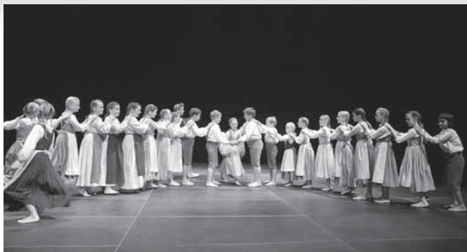
Otroška folklorna skupina Osnovne šole Šentjernej na regijskem srečanju otroških folklornih skupin.