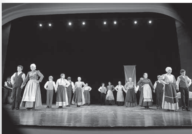
Otroška folklorna skupina Kulturno-turističnega društva Moščanci na regijskem srečanju otroških folklornih skupin.