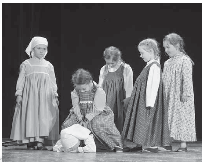
Otroška folklorna skupina Vrtca Manka Golarja iz Gornje Radgone na regijskem srečanju otroških folklornih skupin.