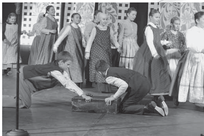
Otroška folklorna skupina iz Brežic na regijskem srečanju otroških folklornih skupin.