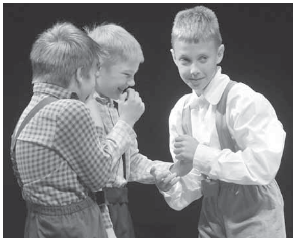
Otroška folklorna skupina Osnovne šole Artiče na regijskem srečanju otroških folklornih skupin.