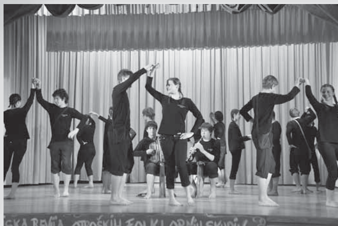
Mladinska folklorna skupina Podkev iz Miklavža pri Ormožu na regijskem srečanju otroških folklornih skupin.