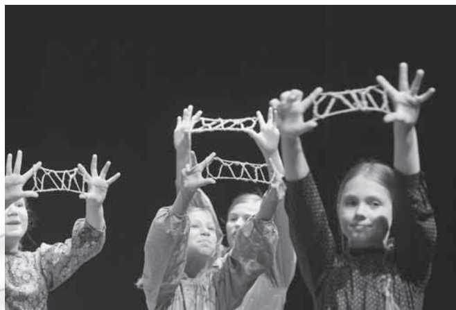
Otroška folklorna skupina Osnovne šole Center iz Novega mesta na regijskem srečanju otroških folklornih skupin.

Najlepša od vseh dejavnosti je folklor. Vesela sem vsakega dobro opravljenega nastopa in zadovoljnega obraza naše mentorice. Rada bi nastopala še velikokrat.