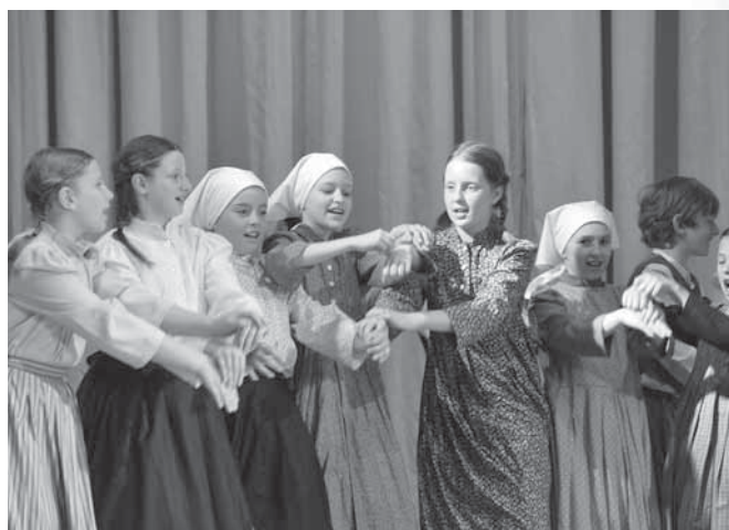
Otroška folklorna skupina iz Makol na regijskem srečanju otroških folklornih skupin.