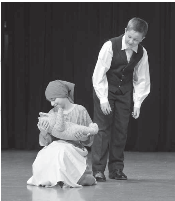
Otroška folklorna skupina Podružnične osnovne šole Pameče na regijskem srečanju otroških folklornih skupin.