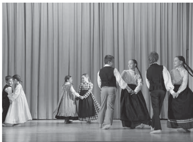
Starejša otroška folklorna skupina iz Dolene na regijskem srečanju otroških folklornih skupin.