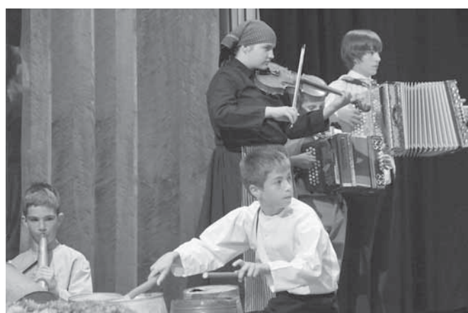
V glasbeno spremljavo Starejše otroške folklorne skupine Osnovne šole Dobropolje sta bila vključena otroka, ki sta zanimivo dopolnila zvočno podobo. (, Ringaraja 2011, Laško, 28. 5. 2011.)