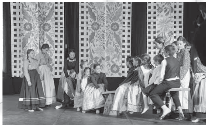
Otroška folklorna skupina Kulturnega društva Vidovo iz Šentvida pri Stični na regijskem srečanju otroških folklornih skupin.

Walt Disney je dejal, da kar lahko sanjaš, moreš tudi uresničiti. Skupine, ki smo jih na Ringaraja 2011 gledali, so sanjale in sanje uresničile. To kažejo tudi kratki prispevki tistih, ki so se odzvali povabilu in v nekaj besed strnili svoje misli. Nekaj jih navajam spodaj.