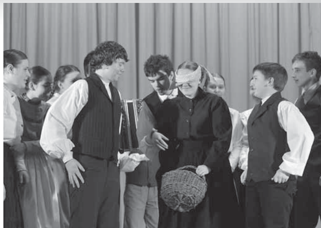
Starejša otroška folklorna skupina iz Destrnika na regijskem srečanju otroških folklornih skupin.