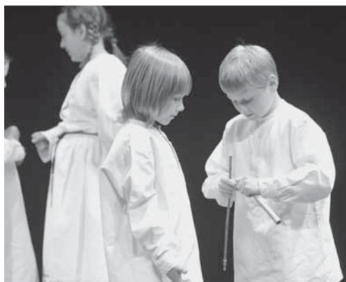
Otroška folklorna skupina Podružnične osnovne šole Loka Črnomelj iz Adlešič na regijskem srečanju otroških folklornih skupin.