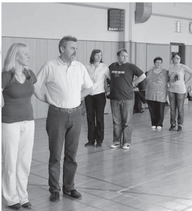
Začetni seminar za vodje odraslih folklornih skupin.

Kot sem jasno začutila, je bil seminar za začetnika zelo naporen. Zame, ki pred seminarjem nisem plesala in sem imela o sebi mnenje, da imam dve levi nogi, še posebej. Vse, kar sem izvedela,