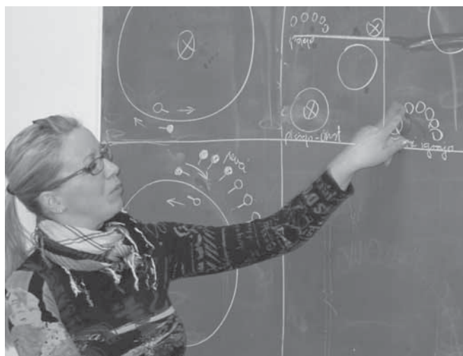
Začetni seminar za vodje otroških folklorne skupin.