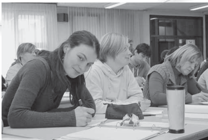
Začetni seminar za vodje otroških folklornih skupin.

V uvodnem razpisu je bilo zapisano, da seminar omogoča pridobitev širokega znanja, ki je danes nujno potrebno za uspešno usmerjanje in vodenje odrasle folklorne skupine, in da se je na njem mogoče okvirno seznaniti z večino prvin, ki jih folklorne skupine vključujejo v svoje programe, in sicer od plesne, glasbene in oblačilne dediščine do s plesom povezanih šeg in navad in še marsičesa drugega. Prav tako s tem, kako vse te vsebine prenašati na oder in v sodobnost.