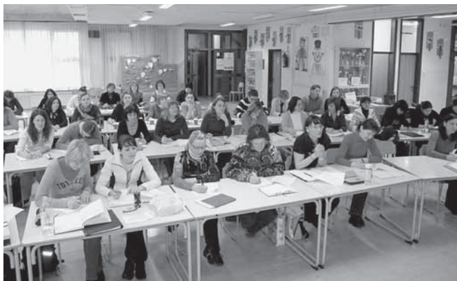
Začetni seminar za vodje otroških folklornih skupin.

Že kar nekaj časa je minilo, odkar je generacija začetnih seminaristov 2010/2011 končala seminar, namenjen pridobitvi naziva strokovni vodja odrasle folklorne skupine. Namenjen je bil vodjem folklornih skupin v kulturno-umetniških društvih in njihovim perspektivnim kadrom, ki bi v prihodnje lahko prevzeli strokovno ali vodstveno delo v folklorni skupini.