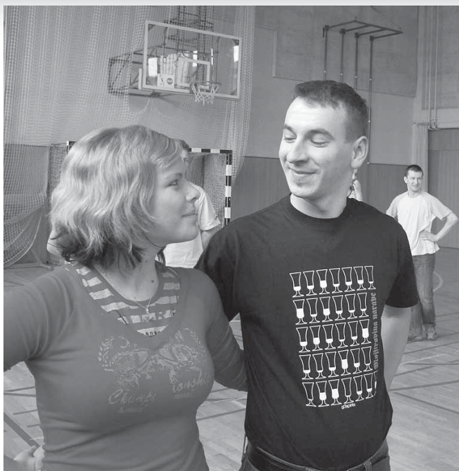
Začetni seminar za vodje odraslih folklornih skupin.