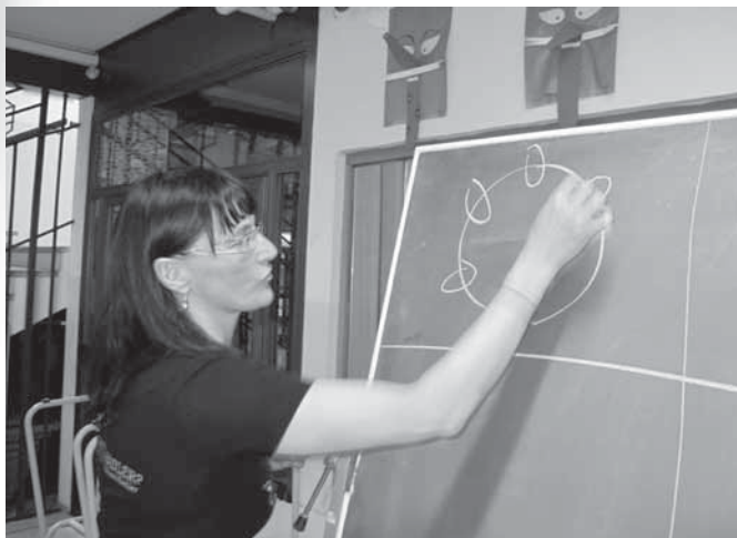
Začetni seminar za vodje otroških folklorne skupin.

Pravzaprav je bilo vsaj na prvem predavanju zastrašujoče, kajti seminaristi smo zaslužili, da pot do cilja ne bo povsem preprosta. Sledila so predavanja in vaje, kjer smo zelo zanimivo in poučno spoznavali, kako lahko plesalce ogrevamo in njim in sebi razvijamo plesnost ter nabiramo kondicijo. Čeprav so bile vaje videti preproste in zabavne, so v svojem bistvu zelo kompleksne. Vsaka mišica telesa se je ogrela – ne le noge, ampak celo telo. Še isti dan smo spoznavali skupinske plesne. Celotno vrsto jih je bilo, in če povem po pravici, sem si od teh plesov zapomnila le enega. Bilo jih je preveč naenkrat in udeleženci, mnogi nevajeni rednega plesanja, smo bili po štirih urah plesanja izčrpani, brez moči