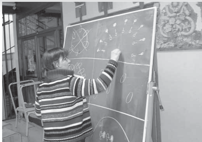
Začetni seminar za vodje otroških folklorne skupin.

in smo samo še čakali, da bo tega končno konec. Tako je minil prvi dan seminarja. Rezultat: petinpolurno plesanje, veliko novih informacij in ugotovitev, da sem popolnoma brez kondicije. Že drugi dan seminarja smo se srečali s kinetografijo. Kaj sploh je kinetografija, sem se spraševala, ko sem dobila urnik prvič v roke. Dobro, da obstaja internet in si lahko določene pojme hitro razjasniš in ni treba več iskati po leksikonih. Tako se je začelo, kinetografija. Verjetno med vsemi nami začetek spoznavanja te snovi sploh ni bila zastrašujoča. »Saj teh par znakov si bomo menda ja zapomnili,« smo se prepričevali vsaj nekateri. Po prvem