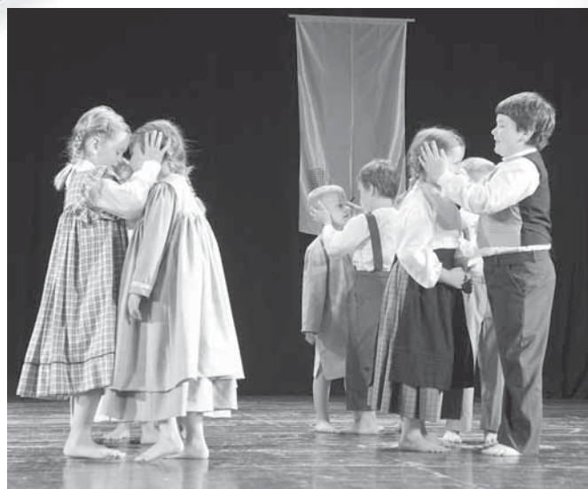
Otroška folklorna skupina Vrtca Križevci na regijskem srečanju otroških folklornih skupin.