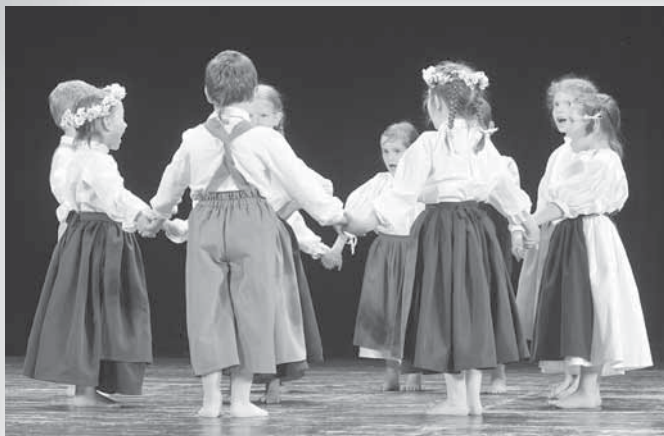
Otroška folklorna skupina Poskočne noge iz Lendave na regijskem srečanju otroških folklornih skupin.

ponudila pomoč in podporo. Vpisala sem se na izobraževalni seminar za pridobitev naziva strokovni vodja otroške folklorne skupine, ki ga je razpisal JSKD, ga uspešno opravila in si pridobila ustrezno znanje.