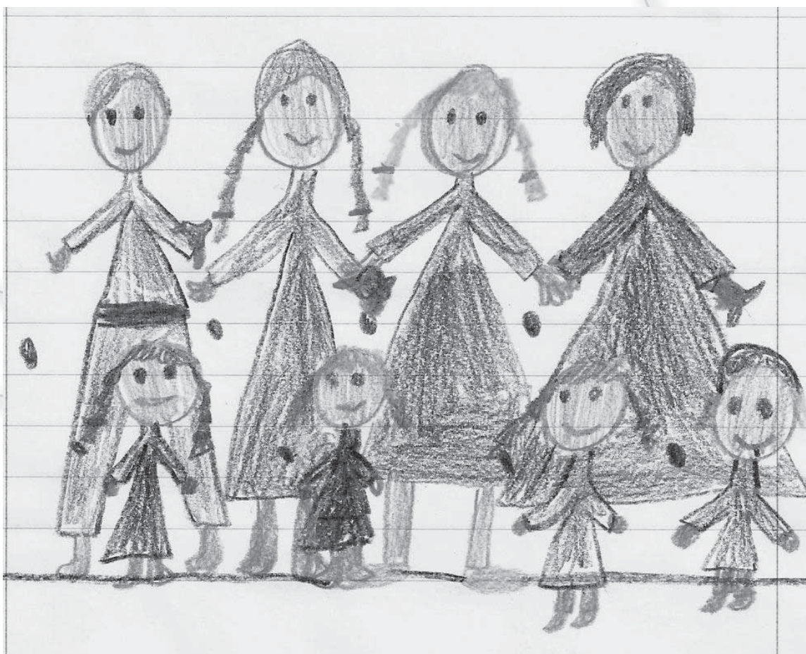
Otroška slika, nastala po prireditvi, kot spomin nanjo.

Osem otroških folklornih skupin se je srečalo 3. marca 2011. Želeli smo, da si nastopajoči ogledajo nastope drugih skupin, k ogledu pa smo povabili tudi učence bližnje šole in vrtcev. Poleg 160 nastopajočih otrok si je prireditve ogledalo še približno 300 mladih gledalcev. S prireditvijo v dopoldanskem času smo izpolnili kar nekaj ciljev tega srečanja: razširiti krog gledalcev folklornih prireditev, pokazati otrokom gledalcem, da je poustvarjanje ljudske dediščine lahko zanimivo, promovirati folklorno dejavnost med mlajšim občinstvom, gledalce navajati na zbrano, kulturno spremljanje prireditev. Zadali pa smo si še en cilj – povezati različne generacije. Zato se je kot zadnja na srečanju predstavila seniorska folklorna skupina Židan parazol.