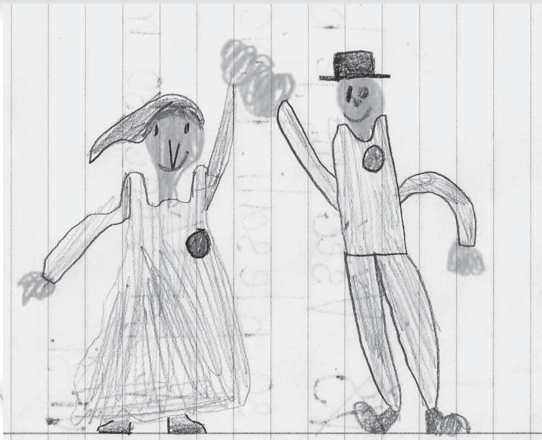
Otroška slika, nastala po prireditvi, kot spomin nanjo.