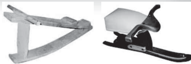
Starejša in mlajša različica pležuha.

Igra je bistveni del otrokovega življenja, ob njej spoznava samega sebe. Prenaša se iz roda v rod, iz generacije v generacijo in se pri tem spreminja, z njo vred pa tudi igrače. V današnjem času odrasli ugotavljamo in se sprašujemo, katere igrače so za otrokov razvoj dobre in katere ne, včasih pa so bili otroci veseli vsake malenkosti, ki jim je bogatila življenje. Marsikateri kamenček in palico so znali spremeniti v igračo. Ker ni bilo denarja, da bi igrače kupovali, so jih pogosto izdelovali kar doma.