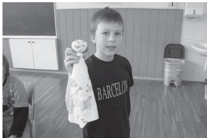
Fant z buto.

Dajmo otrokom možnost, da bodo prek igre zgradili temelje za svoje nadaljnje življenje in se razvili v močne, trdne, pogumne, odločne, ljubeče, čuteče, inovativne in socialne osebnosti.