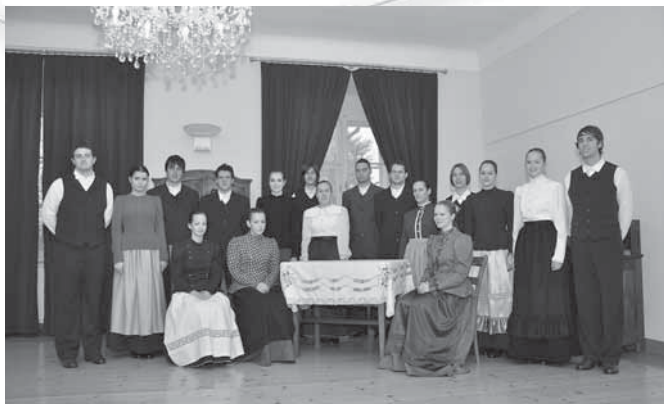
Člani Folklorne skupine Kulturnega društva Marko v novih folklornih kostumih.