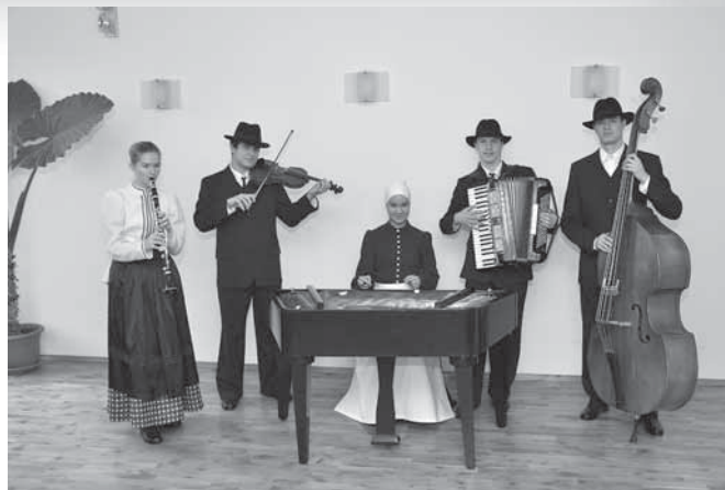
Skupaj s plesalci so bili nove kostumske podobe deležni tudi godci.