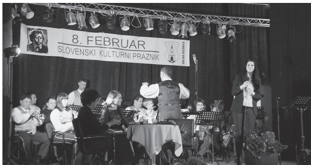
Kulturni praznik 2013.

Večnamenska Modra dvorana Vuzenica. Proslava ob slovenskem kulturnem prazniku. Organizator: TIC Vuzenica.