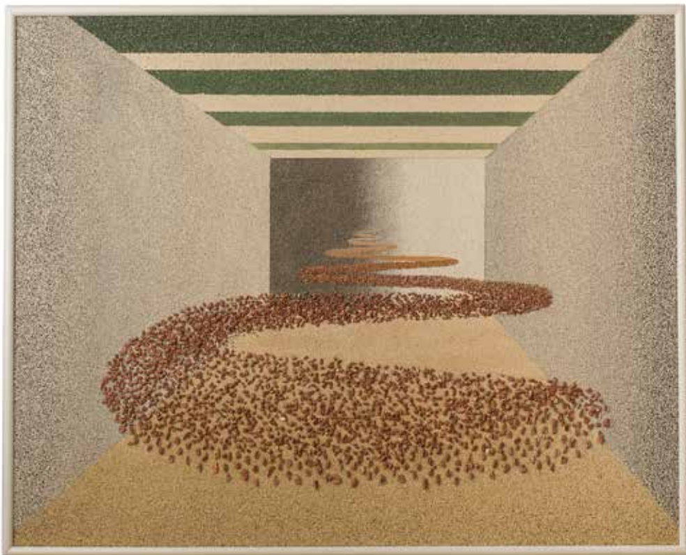
Stanka Golob , Grahovo ob Bači | Pot 100x80, pesek na lesnit