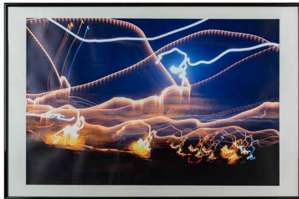
Nejc Bizjak , Ajdovščina | Noč v črti 100x80, fotografija