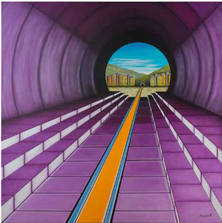
Mirela Maver , Gorenje Nekovo | Tretji tir 100x100, olje na platno