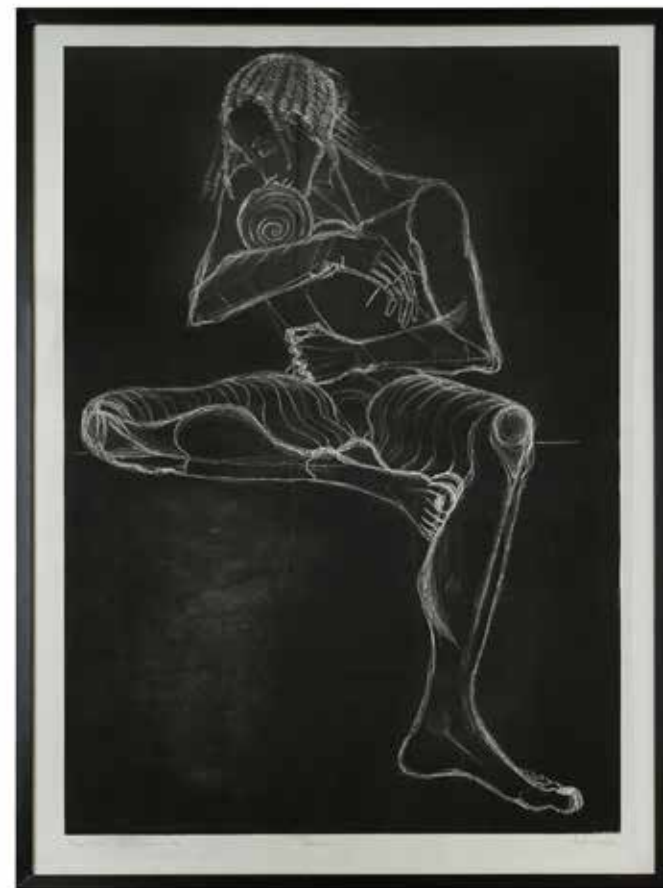
Elvira Vera Mauri , Gorica | Mati 100x70, akvatinta