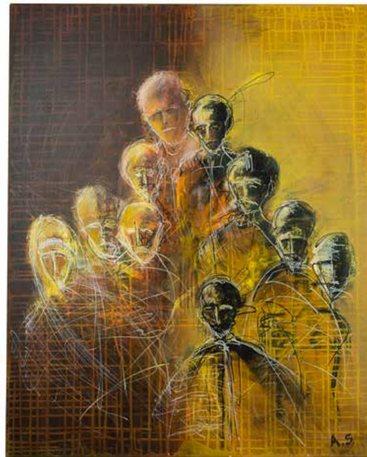
Anton Susič , Bukovica | Ločni 100x80, mešana tehnika