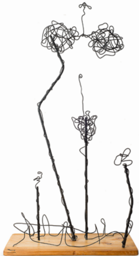
Dare Trobec , Most na Soči | Roža vseh rož 100x50x30 les, žica