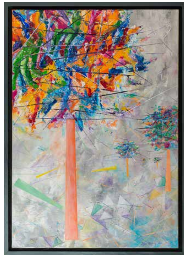
Igor Zimic, Ajševica | Velika črta 100x70, akril na platno