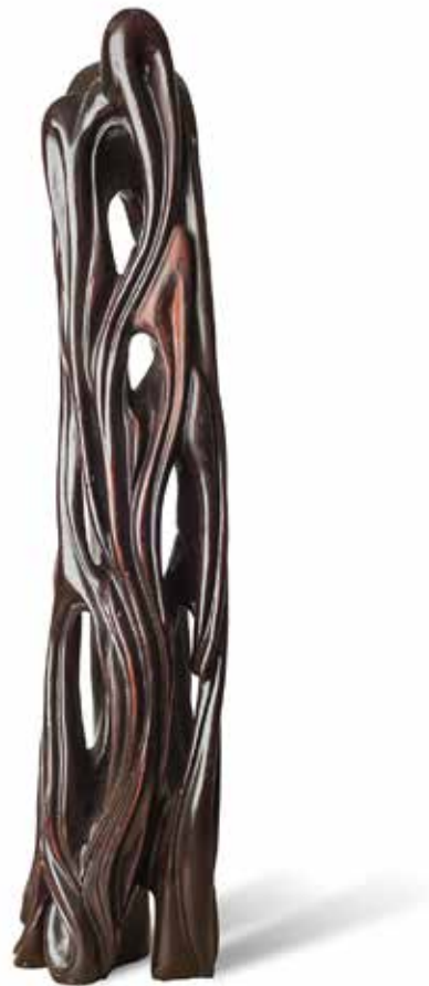
Arijel Štrukelj , Cesta | Creation of the Big Line 102x25x25, les