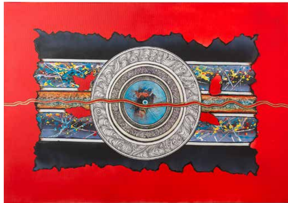
Adriano Velussi , Gorica | Mix na rdeči podlagi 100x70, mešana tehnika