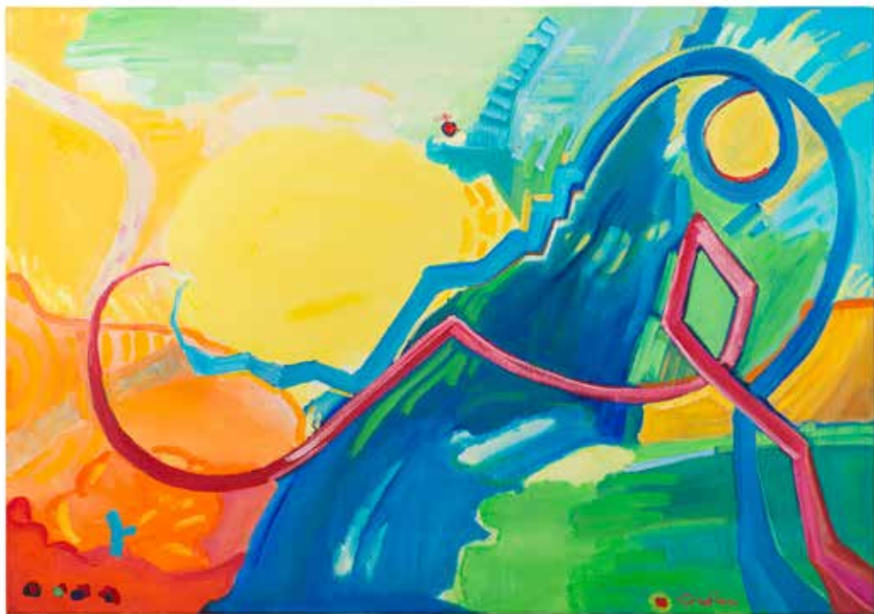
Alda Grudina , Neblo | Življenje je kratko 100x70, olje na platno