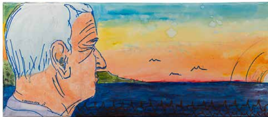
Vera Kostanjšek , Idrija | Zahod 28x106, mešana tehnika