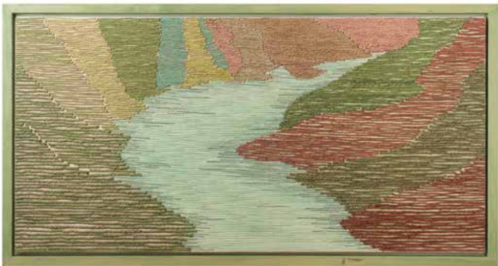
Ida Kocjančič, Miren | Iz klobca na platno 100x50, lepljenka