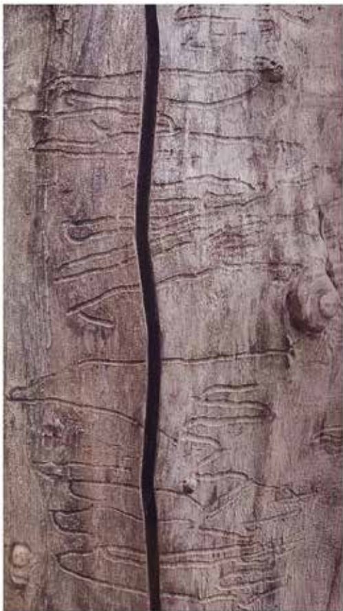
Darja Lavrenčič , Tolmin | Razjede in razpoka 100x56, fotografija