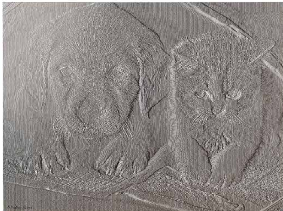
Bogdan Soban , Vrtojba | Prijateljja 100x75, digitalni tisk na platno