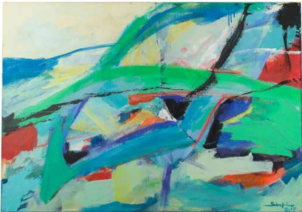
Ivan Skubin , Breg pri Golem Brdu | ... kadar pobegnem ... 100x70, akril na platno