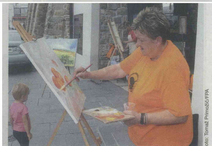
Sladko na platnu