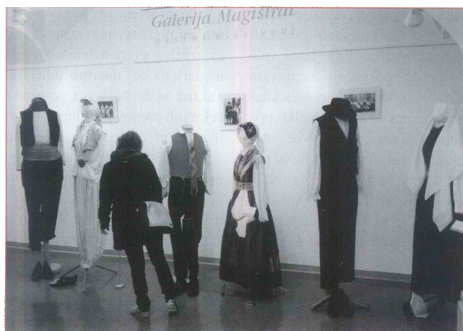
V Galeriji Magistrat je na ogled mednarodna razstava ljudskih kostumov.

kov. »Zasluga za to gre gotovo več kot 500 folklornim skupinam na Slovenskem, ki pod vodstvom različnih strokovnjakov v zadnjih letih še posebej intenzivno raziskujejo in poustvarjajo oblačilne podobe preteklosti.«