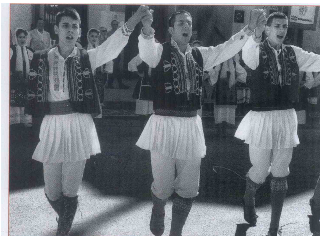
Na mednarodnem festivalu Folklorni kimavčevi večeri so poleg skupin iz Slovenije sodelovale še skupine iz Hrvaške, Bosne in Hercegovine in Makedonije.