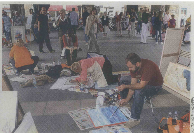
Slikarska vnema tudi na tleh kopske Taverne