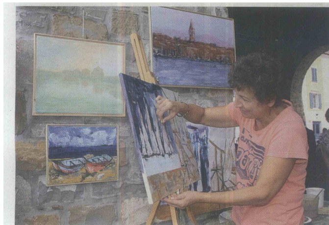
Koliko istrskih motivov ...