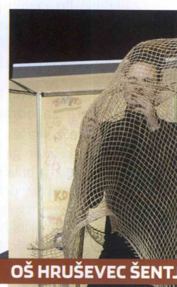
OŠ HRUŠEVEC ŠENTJUR

Zlobi sta obljubili, da ne bosta več počeli.